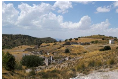
Cortijo El Chato