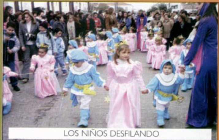
LOS NIÑOS DESFILANDO