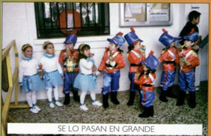
SE LO PASAN EN GRANDE