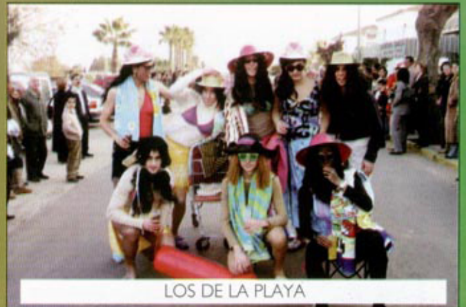
LOS DE LA PLAYA