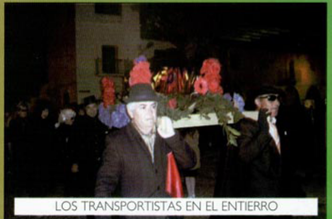
LOS TRANSPORTISTAS EN EL ENTIERRO