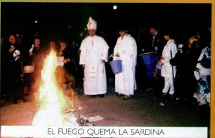
EL FUEGO QUEMA LA SARDINA