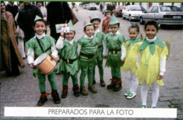
PREPARADOS PARA LA FOTO