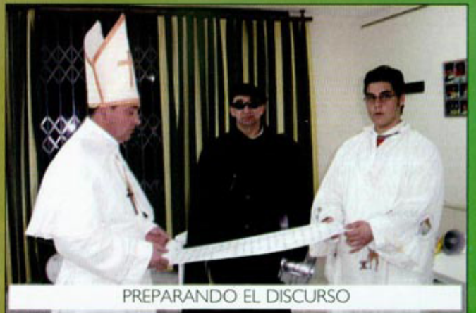
PREPARANDO EL DISCURSO