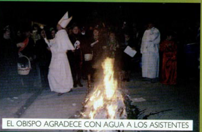
EL OBISPO AGRADECE CON AGUA A LOS ASISTENTES