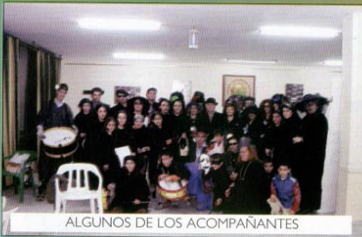
ALGUNOS DE LOS ACOMPAÑANTES