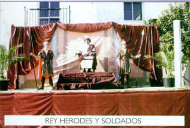
REY HERODES Y SOLDADOS