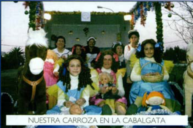
NUESTRA CARROZA EN LA CABALGATA