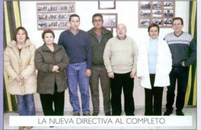
LA NUEVA DIRECTIVA AL COMPLETO