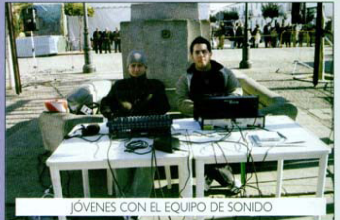
JÓVENES CON EL EQUIPO DE SONIDO