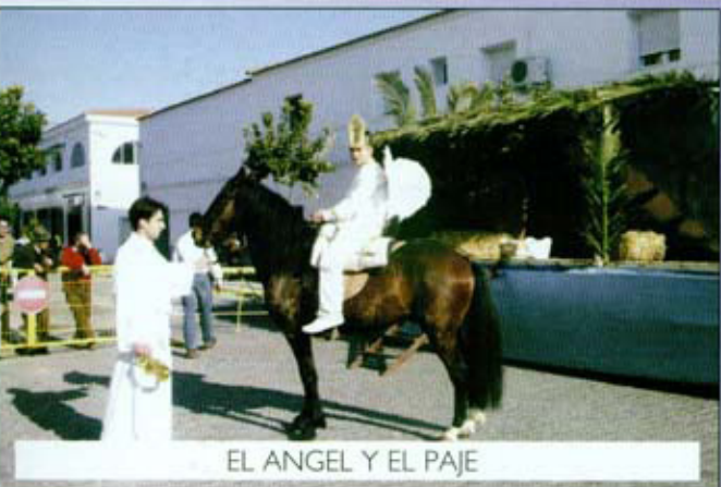
EL ANGEL Y EL PAJE