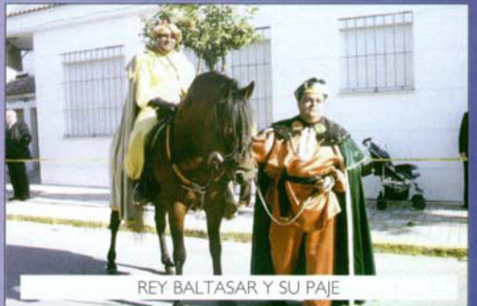
REY BALTASAR Y SU PAJE