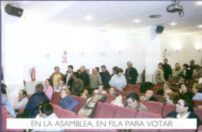
EN LA ASAMBLEA, EN FILA PARA VOTAR