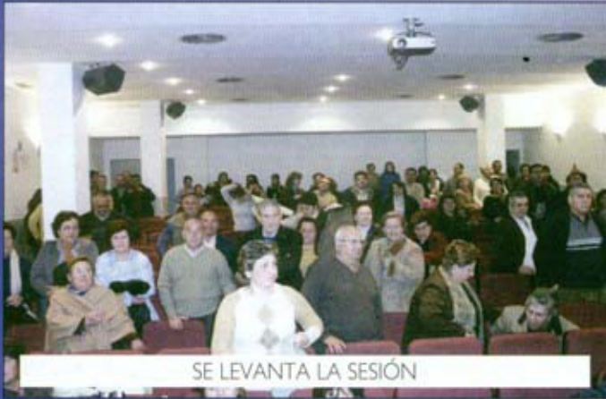
SE LEVANTA LA SESIÓN