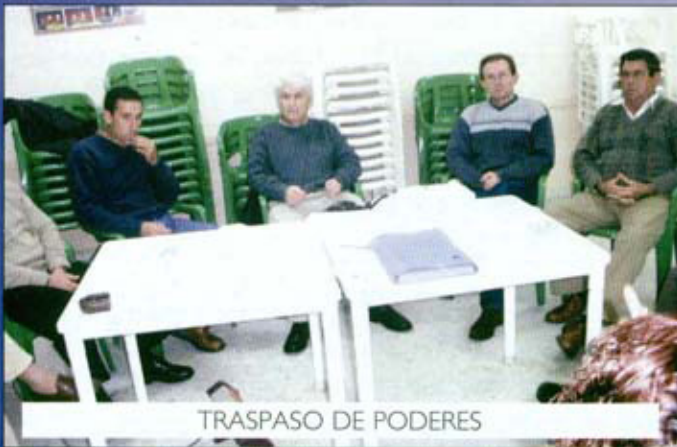
TRASPASO DE PODERES