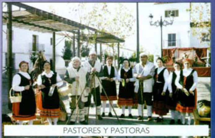
PASTORES Y PASTORAS