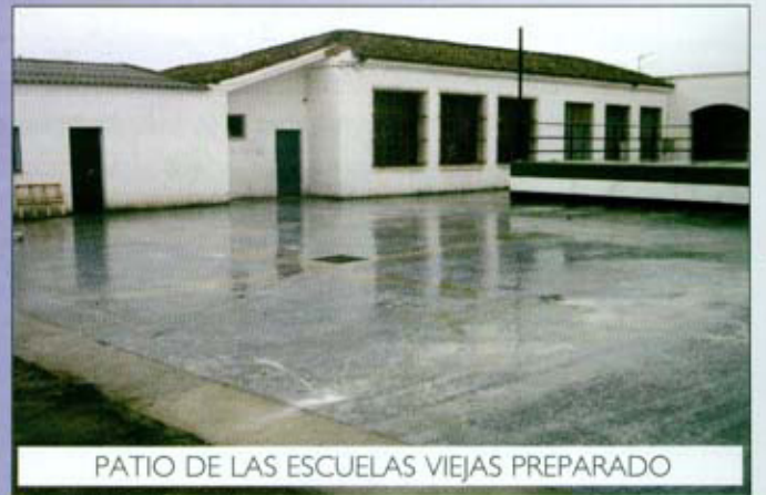
PATIO DE LAS ESCUELAS VIEJAS PREPARADO