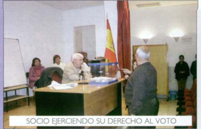
SOCIO EJERCIENDO SU DERECHO AL VOTO