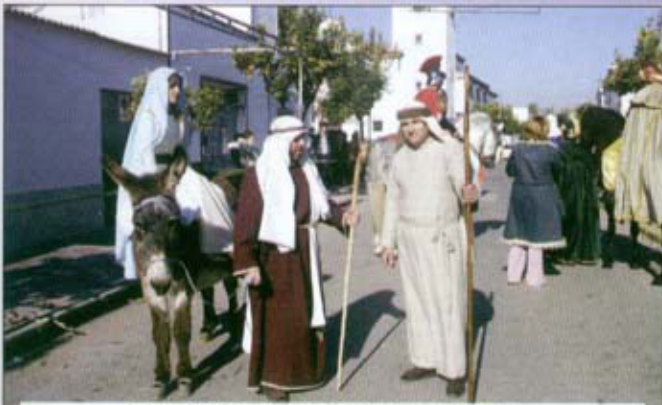
SAN JOSÉ, LA VIRGEN Y EL VECINO