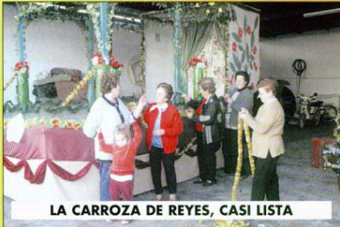
LA CARROZA DE REYES, CASI LISTA