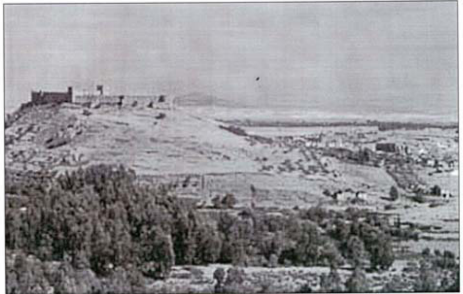
CASTILLO DE MEDELLÍN

Medellín está enclavado entre el Guadiana y su afluente el río Ortigas, en la ladera del cerro donde se encuentra su formidable castillo.