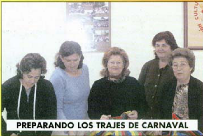
PREPARANDO LOS TRAJES DE CARNAVAL