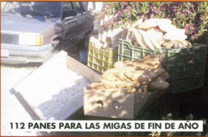
112 PANES PARA LAS MIGAS DE FIN DE AÑO