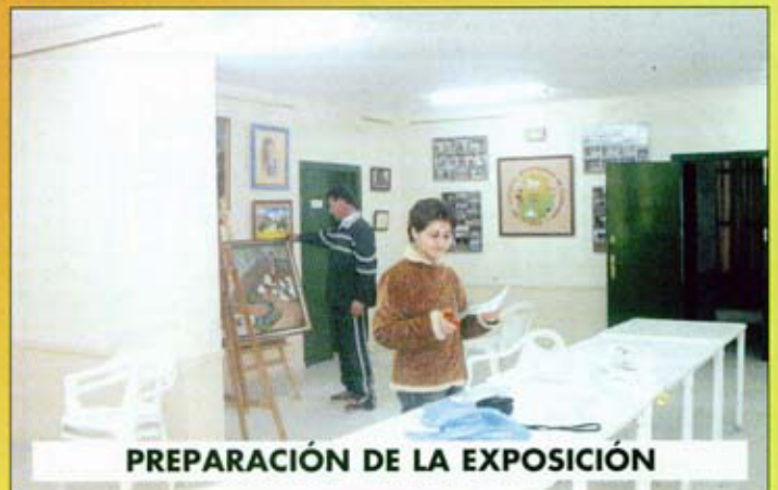
PREPARACIÓN DE LA EXPOSICIÓN