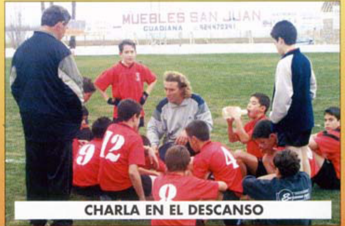
CHARLA EN EL DESCANSO