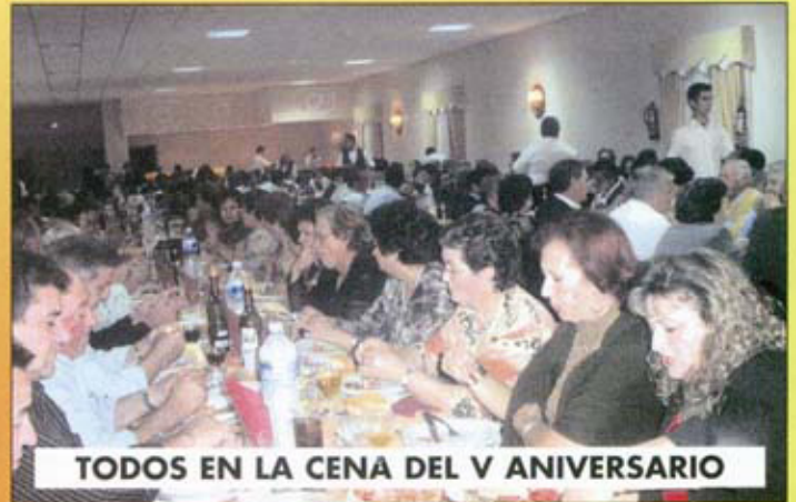
TODOS EN LA CENA DEL V ANIVERSARIO