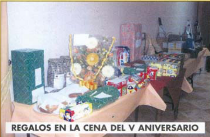
REGALOS EN LA CENA DEL V ANIVERSARIO