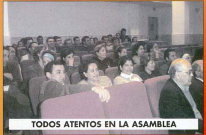
TODOS ATENTOS EN LA ASAMBLEA