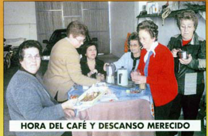
HORA DEL CAFÉ Y DESCANSO MERECIDO