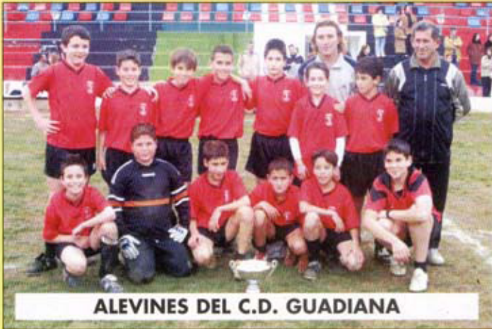
ALEVINES DEL C.D. GUADIANA