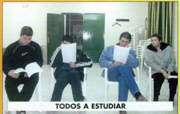
TODOS A ESTUDIAR