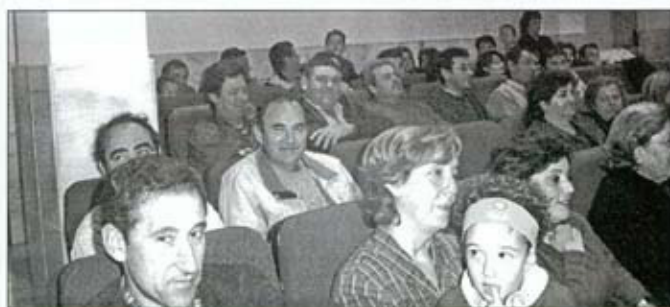
MIGASY CHOCOLATE DE FIN DE AÑO

En la Asamblea General, se presentaron las cuentas y se debatieron temas muy importantes para la buena marcha de la Asociación. Seguimos animando a todos, desde esta revista a que sean más las personas que acudan a estas asambleas. Es muy importante para el buen funcionamiento de la Asociación.