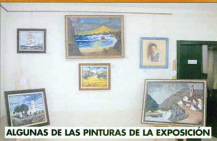
ALGUNAS DE LAS PINTURAS DE LA EXPOSICIÓN