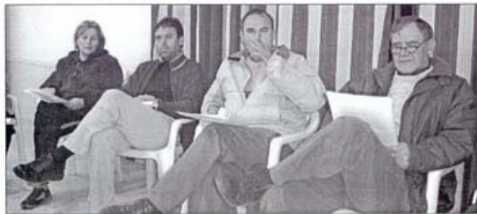
Pabellón Polideportivo, el Viernes Santo a las 9,- de la noche, después de la procesión del Santo Entierro y antes de la procesión de la Virgen de la Soledad.

2) CARNAVALES.- Hay un grupo de personas que han ido a Almendralejo a comprar las telas para hacer los trajes, están midiendo y cortando los trajes a todos los componentes de la comparsa que este año serán unas 70 personas, y ya empiezan también a ensayar con los tambores y los bailes.