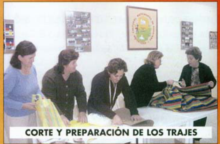
CORTE Y PREPARACIÓN DE LOS TRAJES