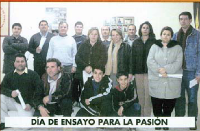
DÍA DE ENSAYO PARA LA PASIÓN