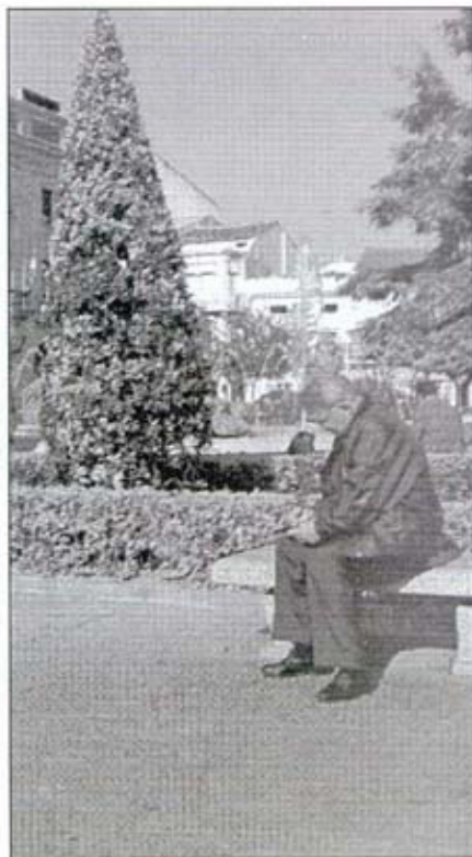
Jardines de Don Benito