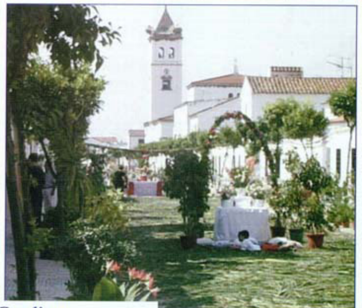
Corpus en Gadiana