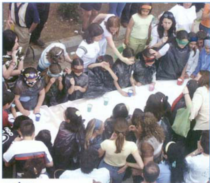
Día de las madres