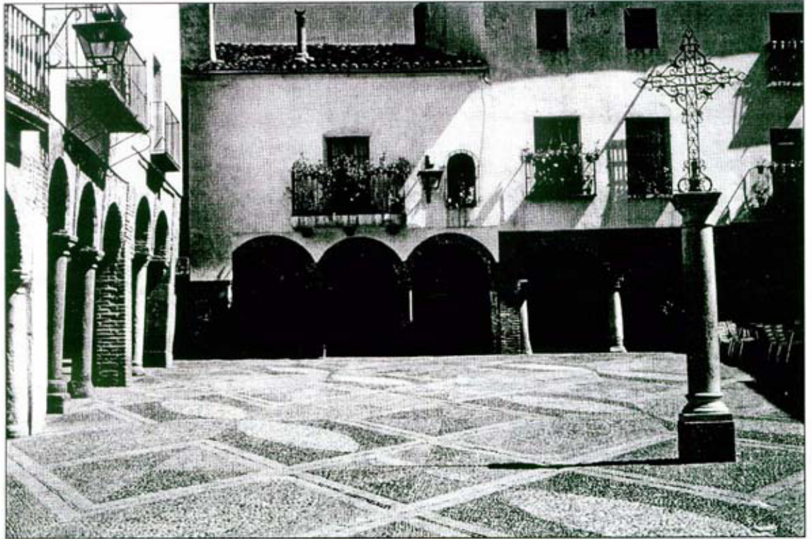
Plaza Chica de Zafra

Todos hemos oído hablar de su feria, su famosa feria ganadera. Pero Zafra guarda plazas, edifi-