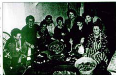
Los dulces ya preparados