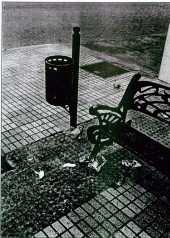
¿Conoce Usted este lugar de su pueblo?

Esto viene a cuento por dos fotos que me han dado, una de ellas la reproducimos en este artículo con el título de: "¿Conoce usted este lugar de su pueblo?"