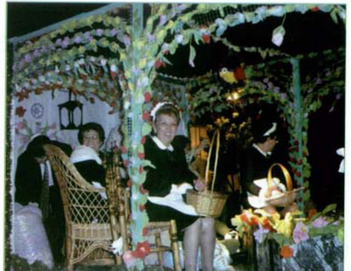
Cabalgata de Reyes