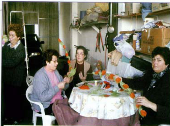
Preparando la Carroza de Reyes