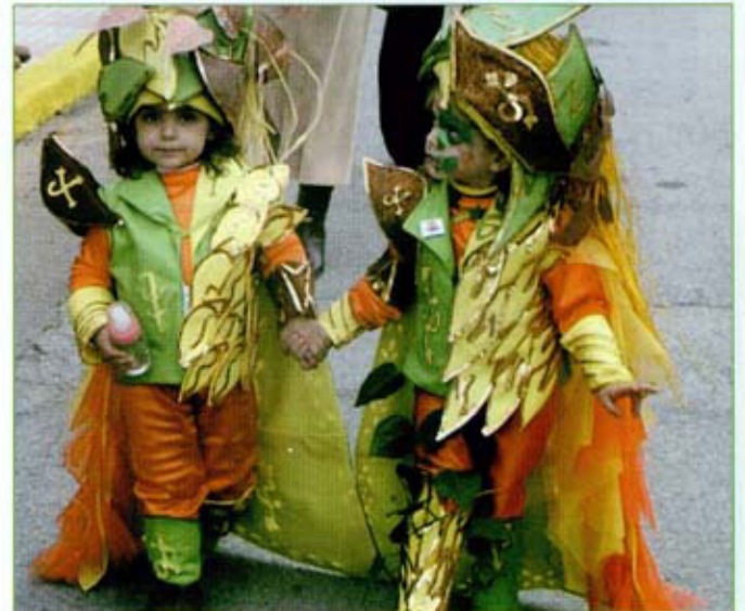
Los niños también disfrutaron del Carnaval