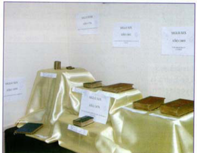
Los más apreciados