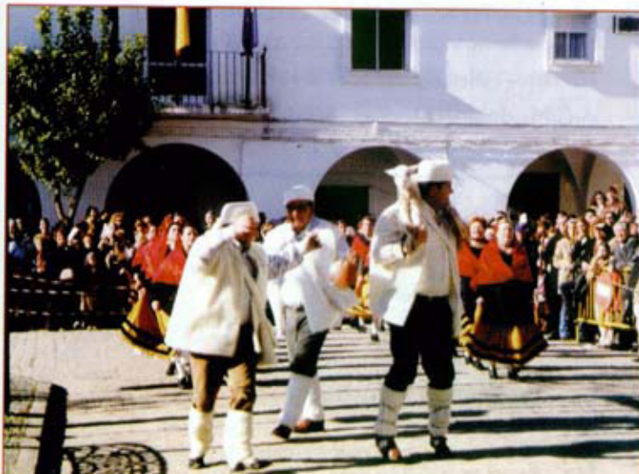
Escena de los pastores en el Auto de los Reyes Magos