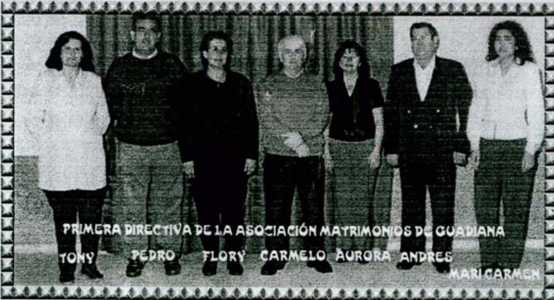
PRIMERA DIRECTIVA DE LA ASOCIACIÓN MATRIMONIOS DE GUADIANA