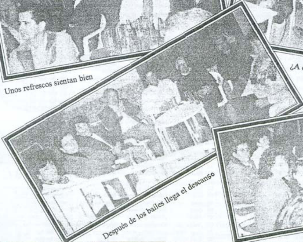
Después de los bailes llega el descanso