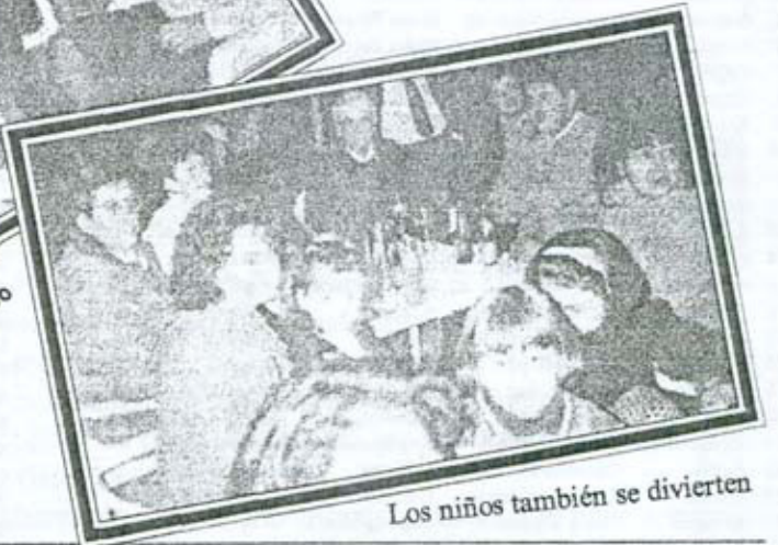
Los niños también se divierten

Si alguien quiere anunciarse en esta Gaceta también puede hacerlo. Comunícalo a la directiva y entre todos haremos una mejor revista.