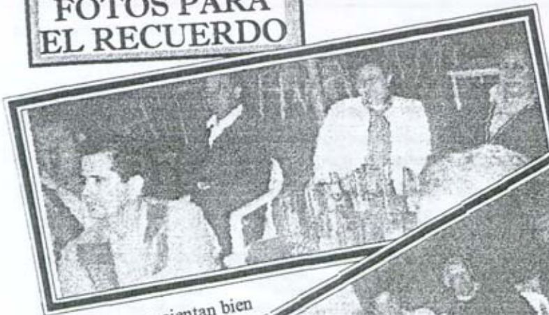
Unos refrescos sientan bien