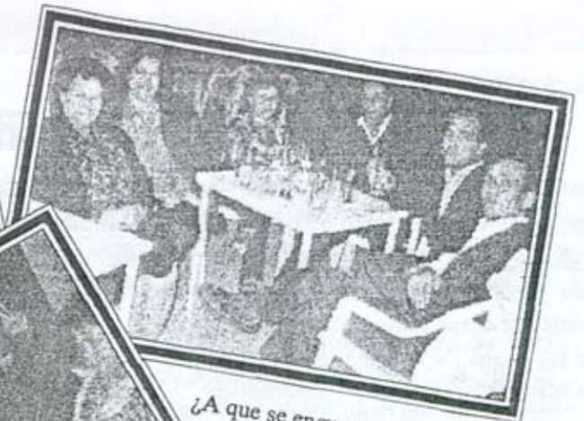
¿A que se encuentran a gusto?