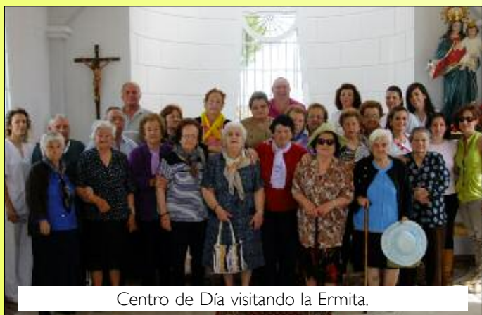
Centro de Día visitando la Ermita.