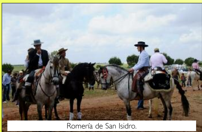
Romería de San Isidro.