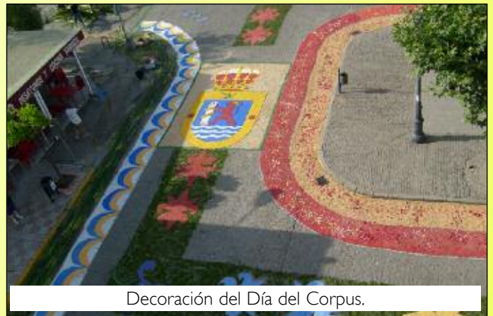
Decoración del Día del Corpus.