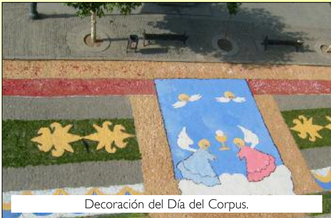
Decoración del Día del Corpus.