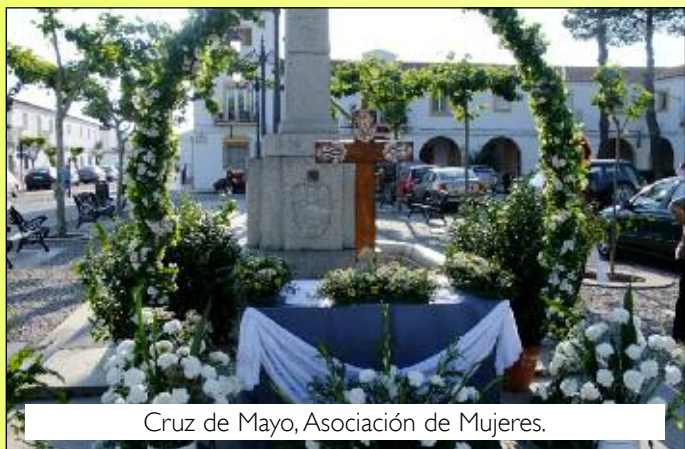
Cruz de Mayo, Asociación de Mujeres.