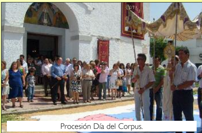
Procesión Día del Corpus.