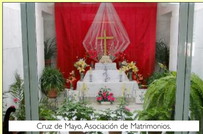
Cruz de Mayo, Asociación de Matrimonios.