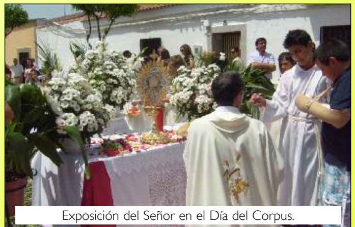
Exposición del Señor en el Día del Corpus.