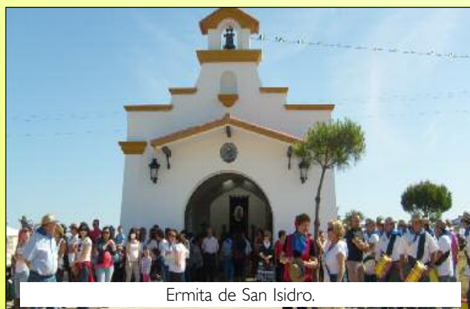
Ermita de San Isidro.