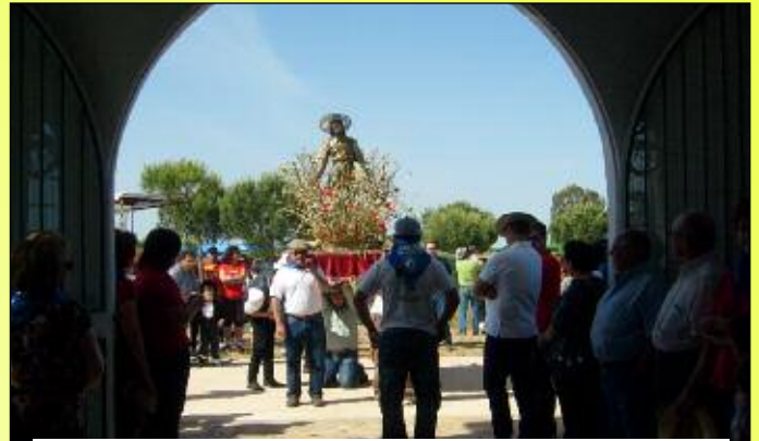
San Isidro entrando en la Ermita.