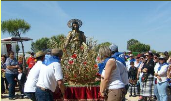
Llegada de San Isidro a la Ermita.