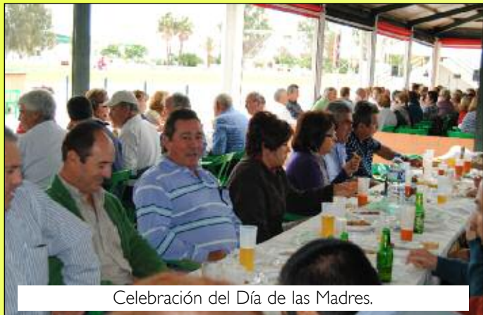
Celebración del Día de las Madres.