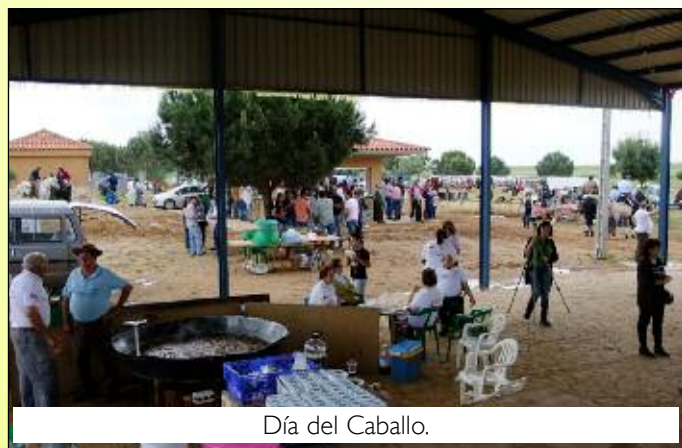
Día del Caballo.