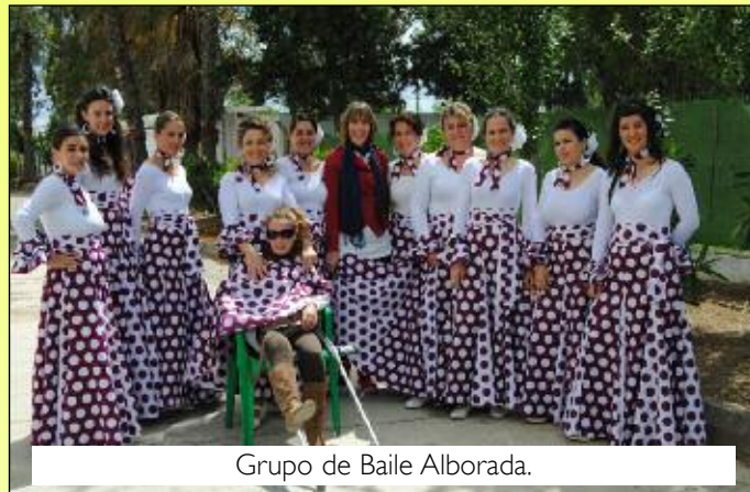
Grupo de Baile Alborada.