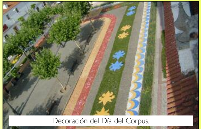
Decoración del Día del Corpus.