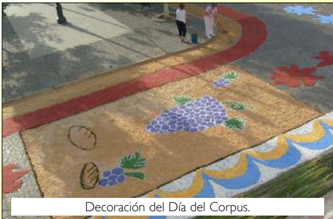
Decoración del Día del Corpus.