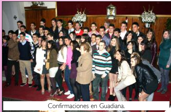
Confirmaciones en Guadiana.