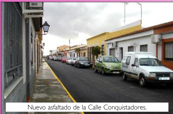
Nuevo asfaltado de la Calle Conquistadores.