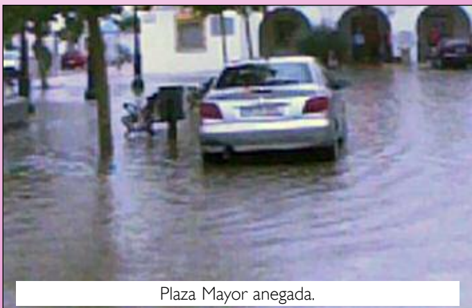
Plaza Mayor anegada.