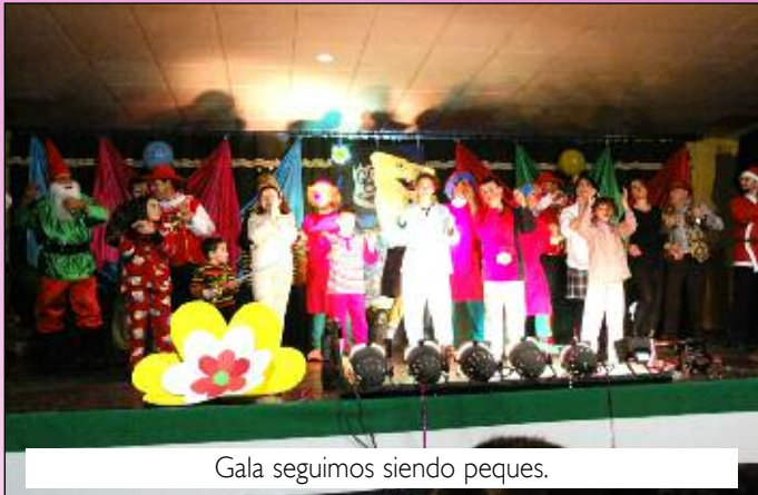
Gala seguimos siendo peques.