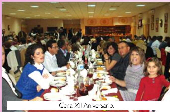
Cena XII Aniversario.