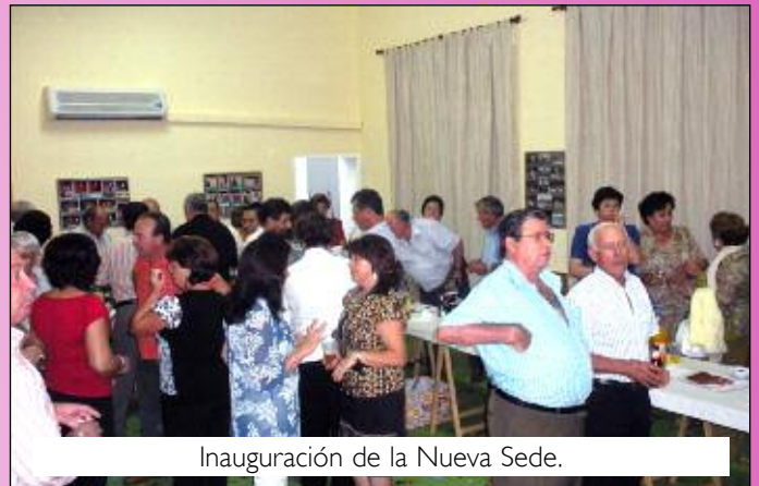
Inauguración de la Nueva Sede.