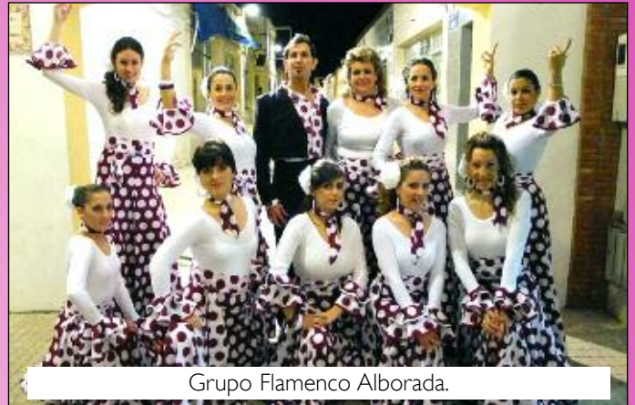
Grupo Flamenco Alborada.