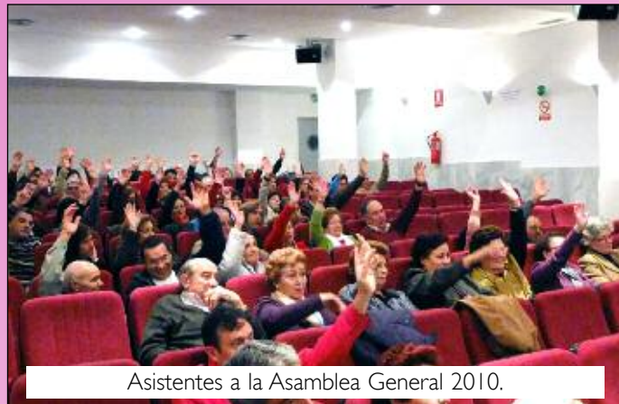
Asistentes a la Asamblea General 2010.