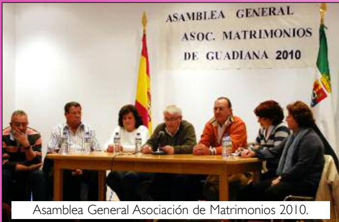
Asamblea General Asociación de Matrimonios 2010.