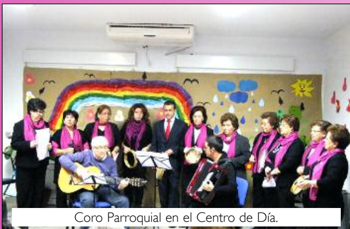
Coro Parroquial en el Centro de Día.