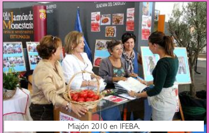
Miajón 2010 en IFEBA.