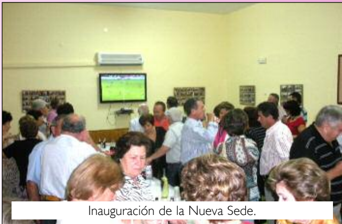
Inauguración de la Nueva Sede.