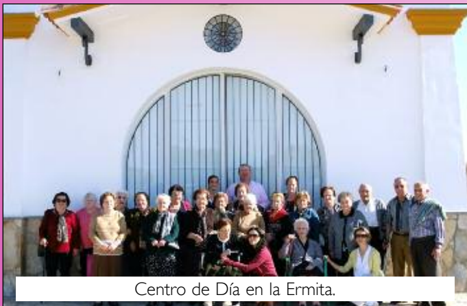
Centro de Día en la Ermita.