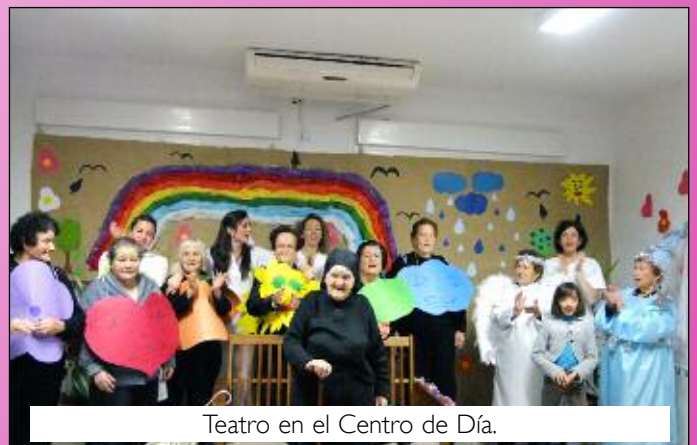
Teatro en el Centro de Día.