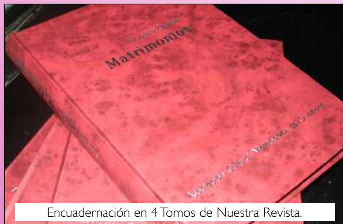
Encuadernación en 4 Tomos de Nuestra Revista.