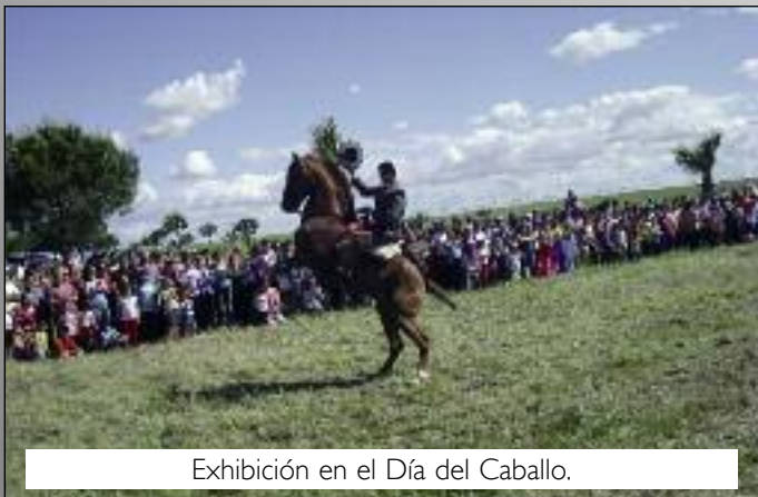
Exhibición en el Día del Caballo.