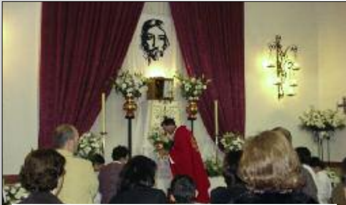
Monumento de Semana Santa.