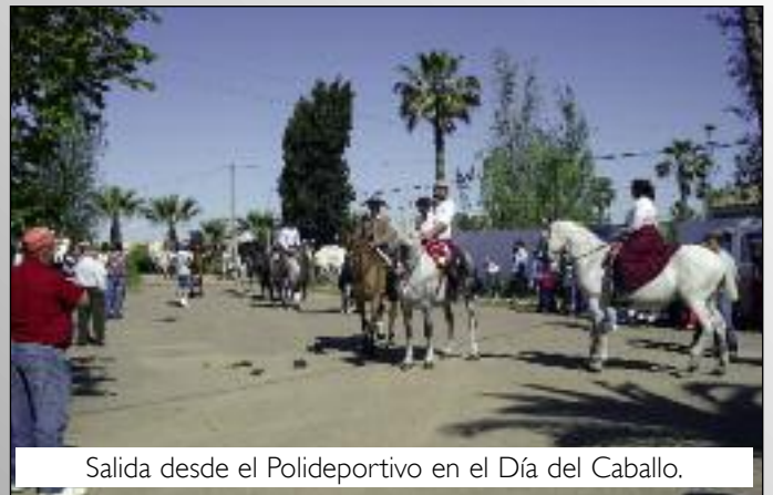
Salida desde el Polideportivo en el Día del Caballo.