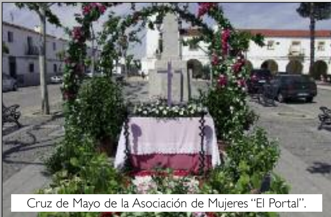
Cruz de Mayo de la Asociación de Mujeres "El Portal".