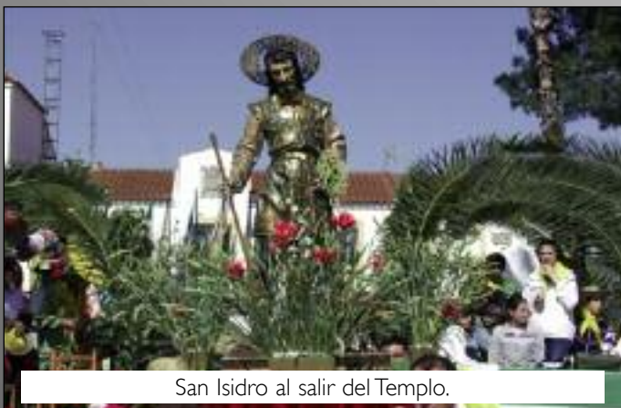
San Isidro al salir del Templo.