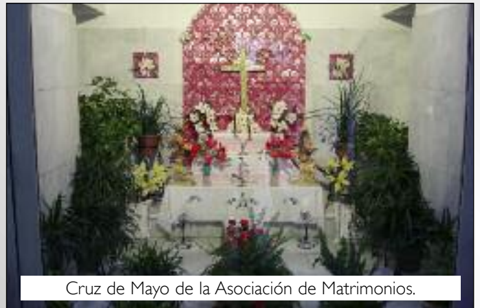
Cruz de Mayo de la Asociación de Matrimonios.