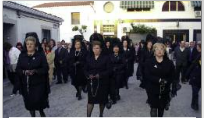
Mujeres con Mantilla en el Santo Entierro.