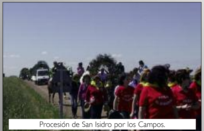
Procesión de San Isidro por los Campos.