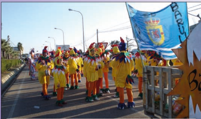
Desfile de Carnaval de amarillo.