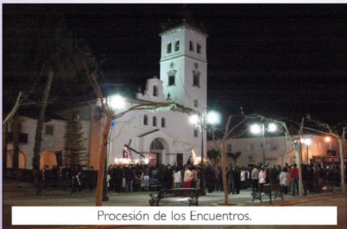
Procesión de los Encuentros.