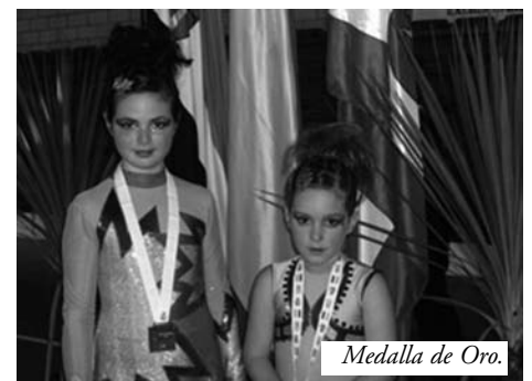
Medalla de Oro.