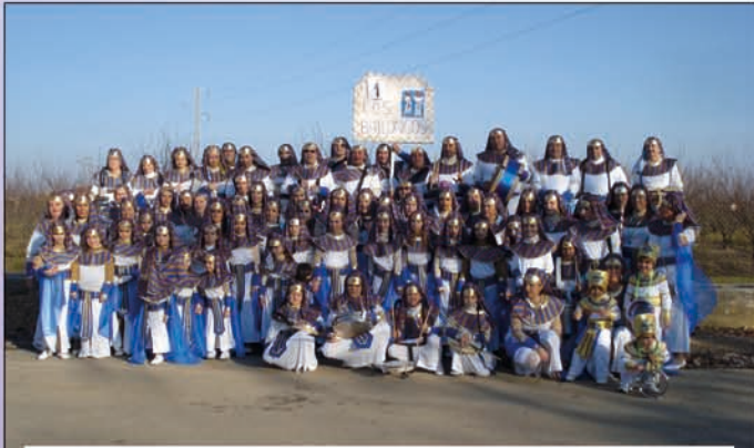
Comparsa Los Bailongos.