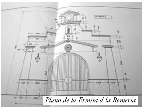
Plano de la Ermita d la Romería.

Esta Semana han comenzado las obras en la parcela de la romería "Piedehierro", El estudio que tenía preparado desde hace meses, el Ayuntamiento de Guadiana, estaba compuesto por tres proyectos para hacer obras en la parcela de la Charca Piedehierro (Romería): 1) Una Ermita 2) Un bar 3) Poner el techo a toda la pista de baile y escenario de la romería.