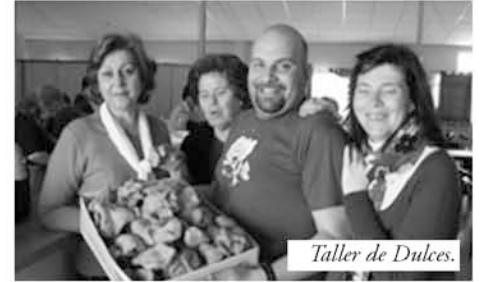
Taller de Dulces.

Dentro del programa de actividades de Semana Santa de Guadiana, esta ha comenzado con un taller de dulces organizado por la Asociación de mujeres el Portal y la Asociación Cultural los Mismos.