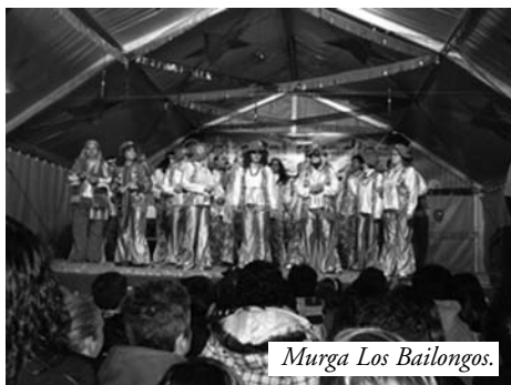
Murga Los Bailongos.

En primer lugar a las 12,30 de la mañana, tuvo lugar el desfile de los niños del colegio público San Isidro. A las 17,- horas tuvo lugar el desfile infantil, los niños de la guardería, junto a sus profesoras. A las 21,- horas en la Carpa instalada en la plaza, les toco el turno a las tamboradas y murgas. En total actuaron para todos nosotros, 256 personas, a la terminación de todas las actuaciones, para cada componente, el ayuntamiento les tenía preparado su bocadillo y su cerveza o refresco.