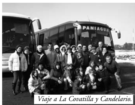
Viaje a La Covatilla y Candelario.

La Asociación Cultural Matrimonios de Guadiana, organizo un viaje el pasado sábado 30 de enero, a la Covatilla y Candelario. En primer lugar el autobús subió a la estación de esquí La Covatilla, en un día espléndido, donde a una altura de más de 1.300 metros, brillaba el sol en toda su intensidad. Por la tarde bajamos a Candelario, donde todos los participantes de la