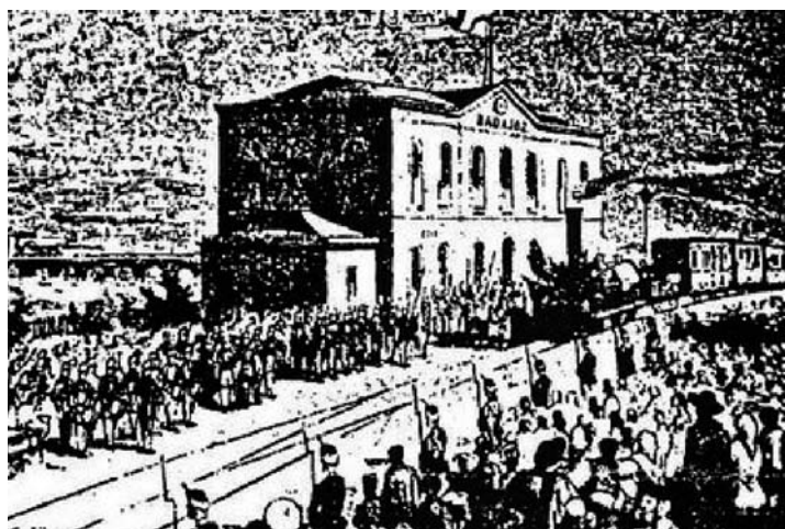
La fotografía es de la estación de Badajoz, cuando entró el primer tren procedente de Elvas.

Si alguno se siente ofendido pido disculpas, pero así fue en el año si la memoria no me falla 1953.