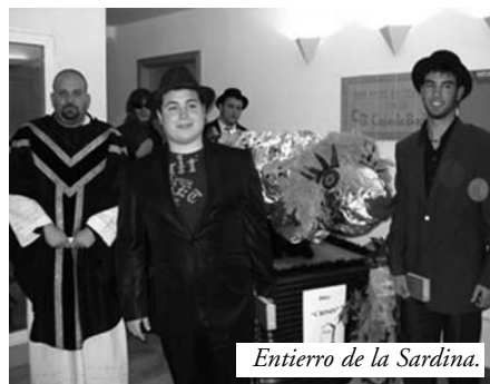
Entierro de la Sardina.

Guadiana, invitadas al mismo, se les convoco en la plaza Mayor, aunque la sardina se encontraba dentro de la Casa de la Cultura, por lo que muchas personas, al quedarse fuera, no pudieron oír el primer responso, del Cardenal (el de Águila Roja), que delante de la sardina les dirigió a los dolientes. Cuando salió el entierro a la Plaza eran muchísimas las personas que esperaban a la susodicha sardina, y en la fuente, el obispo (Abel Guerrero) dirigió a todos los presentes un emotivo responso.