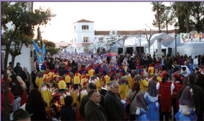
Todos en la Plaza.