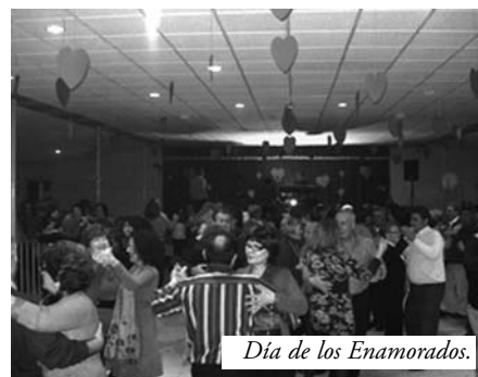
Día de los Enamorados.

El pasado sábado 20. Como cada año, y van 12, al llegar San Valentín (día de los enamorados), la Asociación Cultural Matrimonios