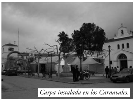
Carpa instalada en los Carnavales.