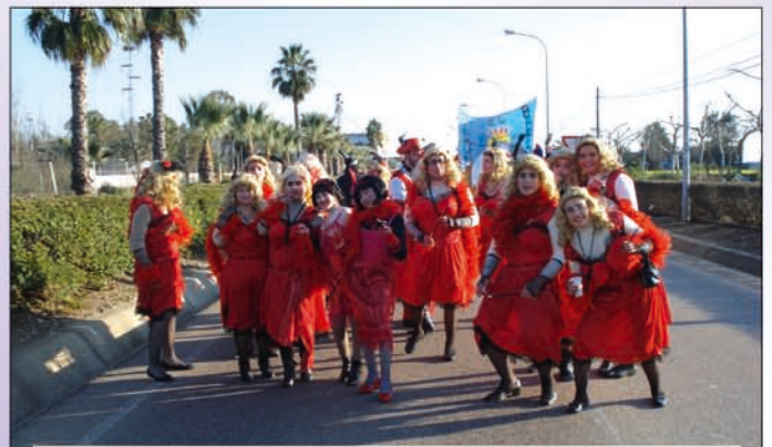
Desfile de Carnaval de rojo.