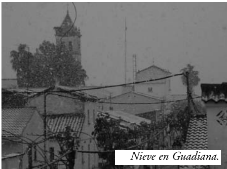
Nieve en Guadiana.

Hoy domingo día 10 a las 16 horas ha empezado a nevar en nuestro pueblo, hacía muchos años que la nieve no nos visitaba. Solo han sido unos minutos, pero los suficientes, para que muchos vecinos de nuestro pueblo salieran a la calle, para ver cómo caía este precioso elemento.