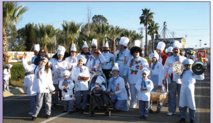
Estos si que cocinan...