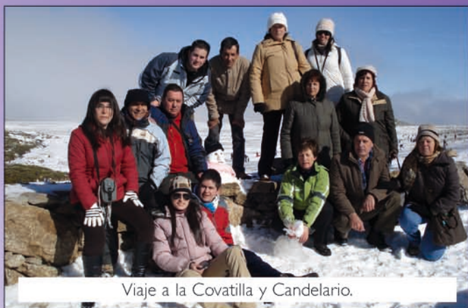
Viaje a la Covatilla y Candelario.