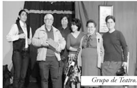
Grupo de Teatro.