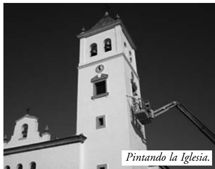
Pintando la Iglesia.

El día 25 trabajadores del Ayuntamiento de Guadiana, estaban lavando a presión, la torre de la iglesia Ntra. Sra. de la Soledad de nuestro pueblo. Pues bien ya han empezado a pesar del mal tiempo que está haciendo con la pintura.