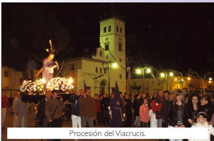
Procesión del Viacrucis.