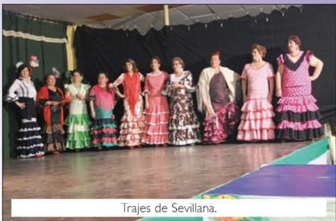
Trajes de Sevillana.