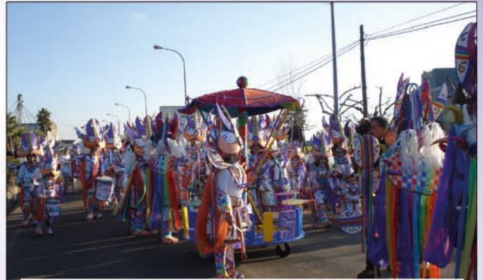
Comparsa Los Mismos.