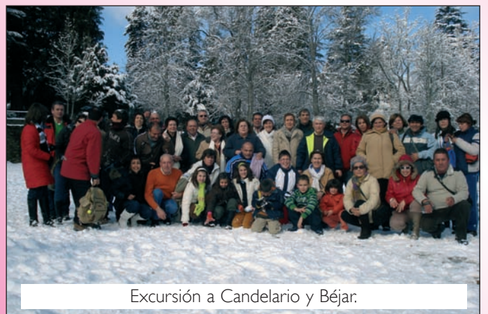
Excursión a Candelario y Béjar.