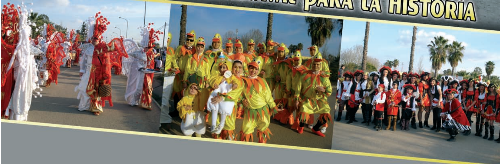
Carroza de los Matrimonios