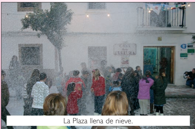
La Plaza llena de nieve.