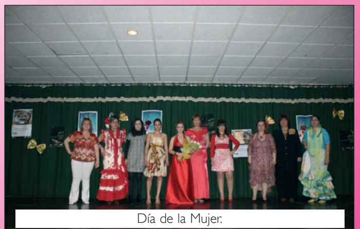
Día de la Mujer.