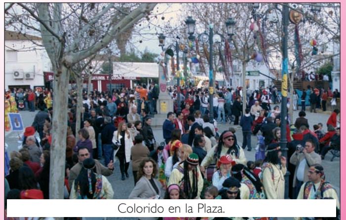
Colorido en la Plaza.