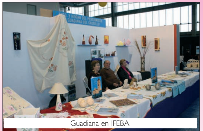
Guadiana en IFEBA.