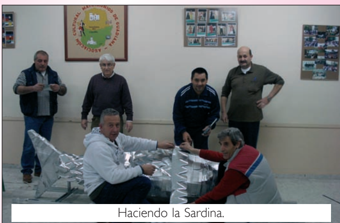
Haciendo la Sardina.