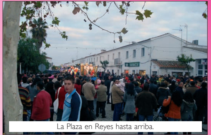
La Plaza en Reyes hasta arriba.