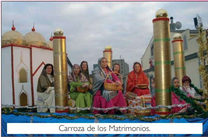
Carroza de los Matrimonios.