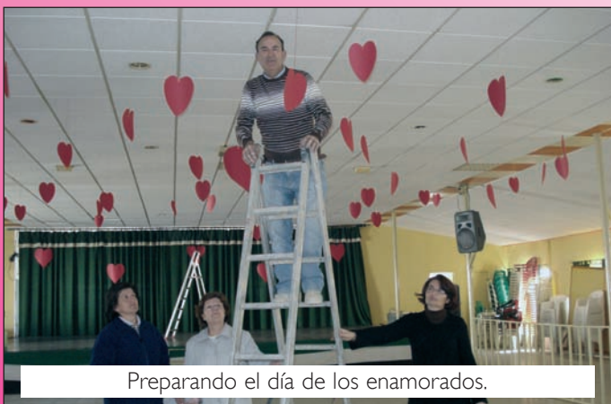
Preparando el día de los enamorados.