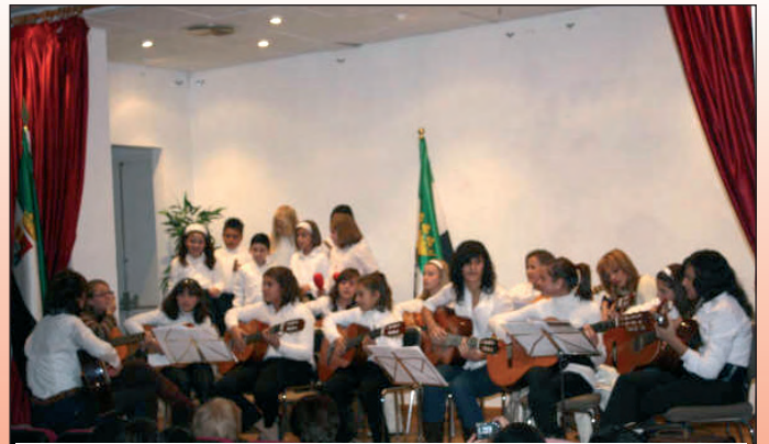
Escuela de Música.