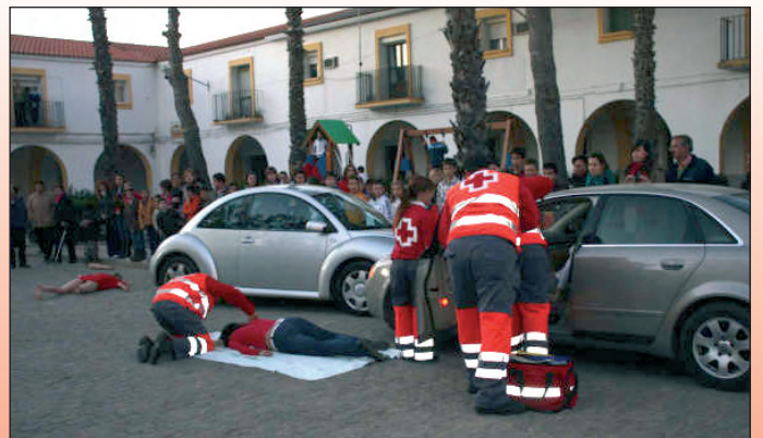
Simulacro de accidente.