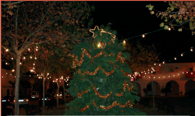
Navidad en la Plaza.