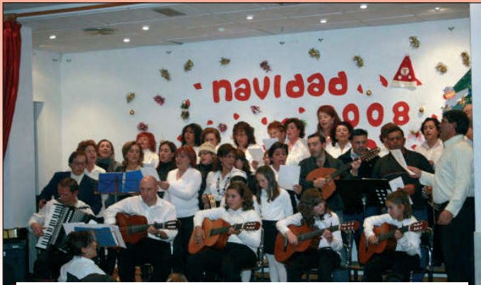
Certamen de Villancicos.