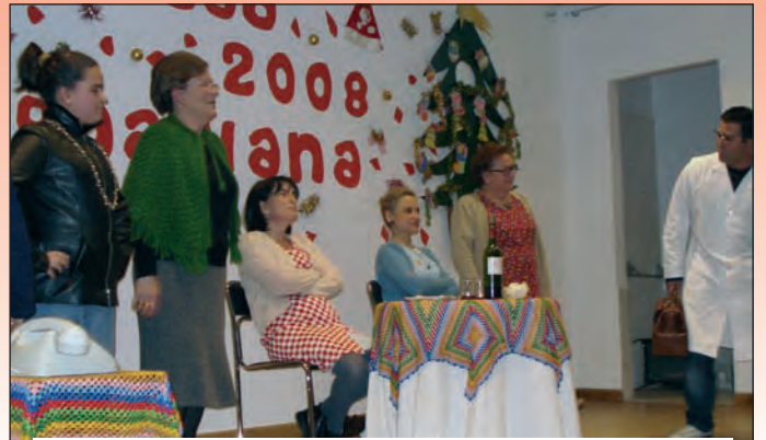
Obra de teatro: Hoy te toca a tí.