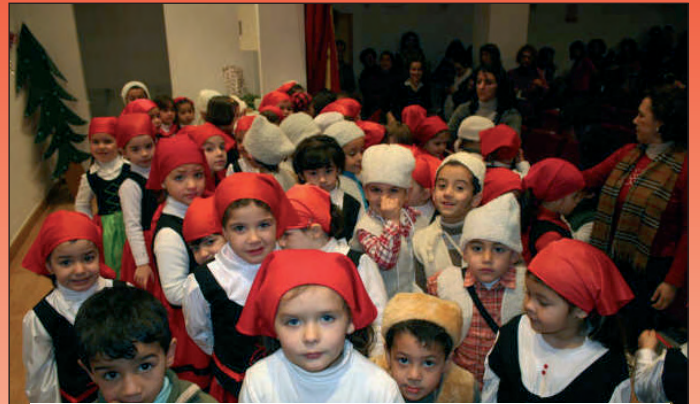
Navidad con los niños del colegio.