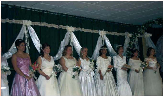
Desfile de Novias.