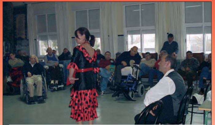
Actuación en la Casa de la Misericordia.