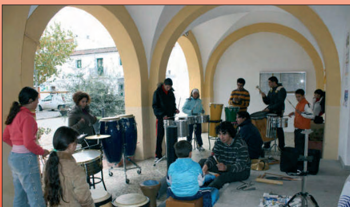
Taller de percusión.