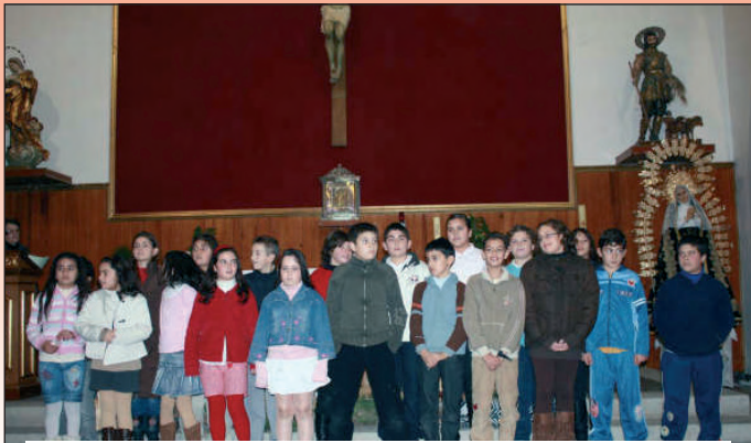
Niños de catequesis.