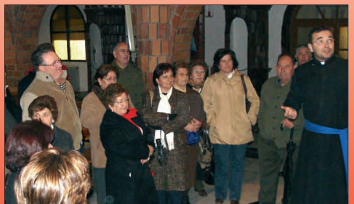
Visita a Alcuescar.