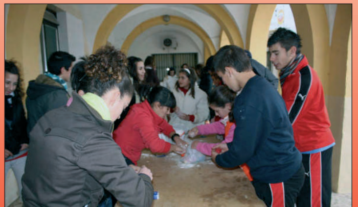
Manualidades en los portales.