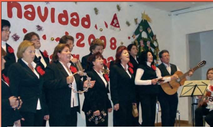
Actuación del Coro Parroquial.