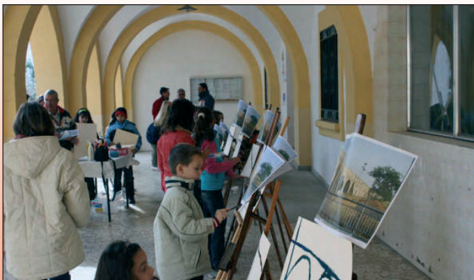
Pintura sobre el puente.