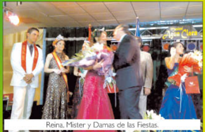
Reina, Mister y Damas de las Fiestas.