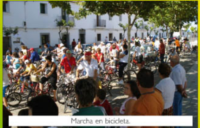
Marcha en bicicleta.