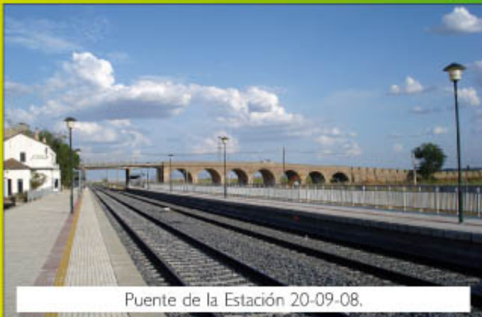
Puente de la Estación 20-09-08.