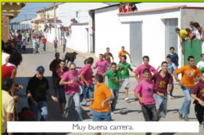
Muy buena carrera.