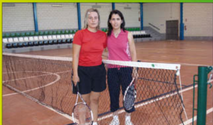
Finalistas de tenis femenino.