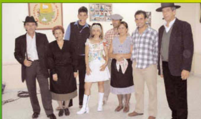
El médico a palos.