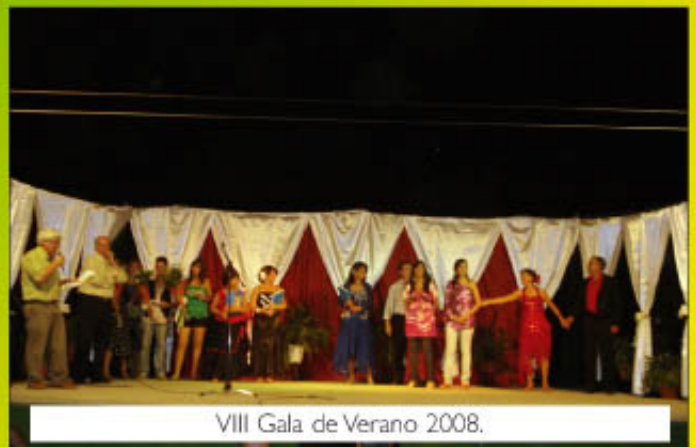
VIII Gala de Verano 2008.