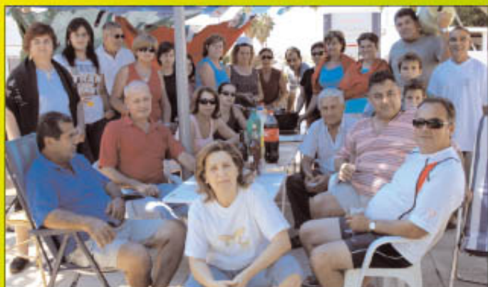
¡Que bien celebran el Día de Extremadura!