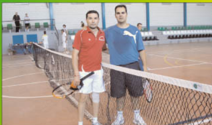
Finalistas de tenis masculino.