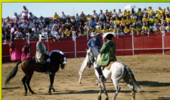
El arte del rejoneo.