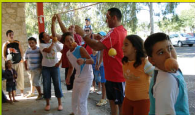
Concursos en la Feria