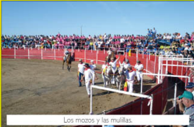
Los mozos y las mulillas.