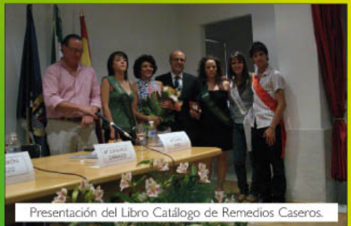
Presentación del Libro Catálogo de Remedios Caseros.