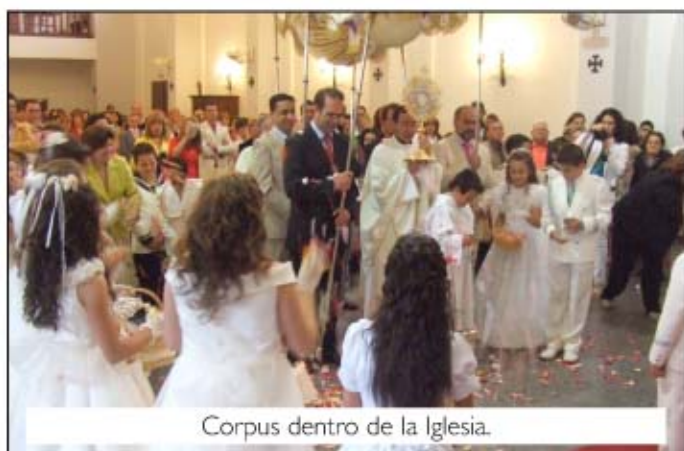
Corpus dentro de la Iglesia.