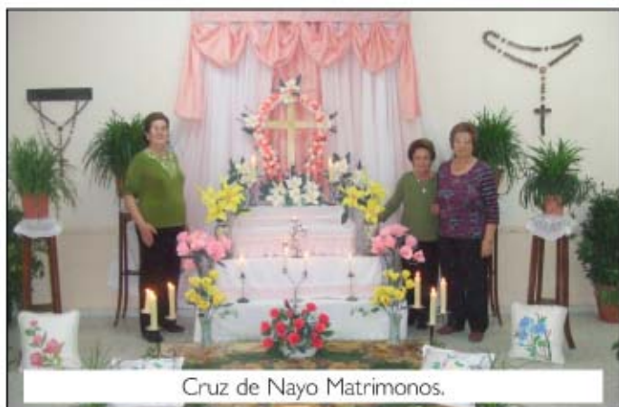
Cruz de Nayo Matrimonios.