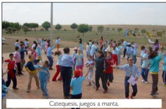
Catequesis, juegos a manta.