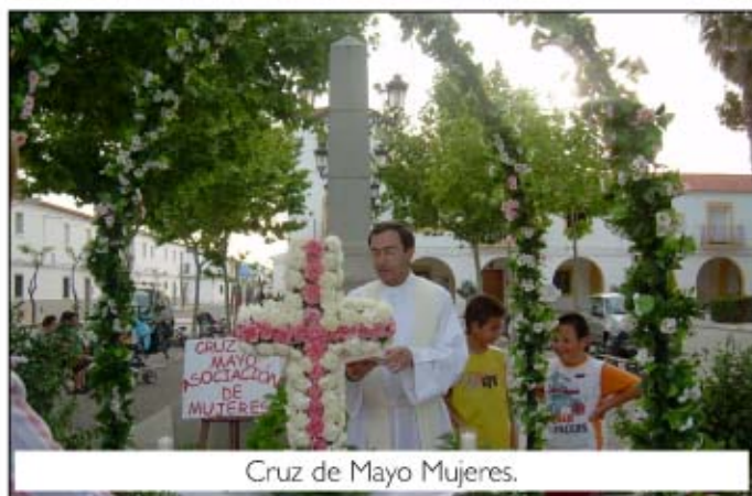
Cruz de Mayo Mujeres.