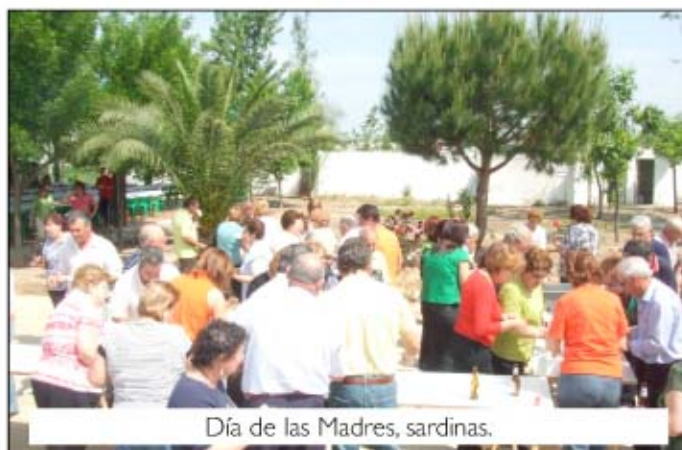
Día de las Madres, sardinas.