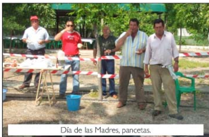
Día de las Madres, pancetas.