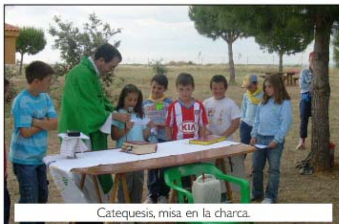
Catequesis, misa en la charca.