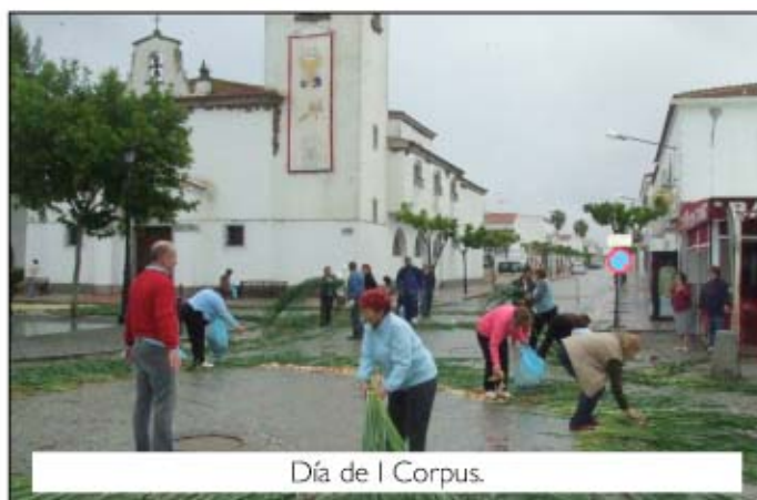
Día de I Corpus.