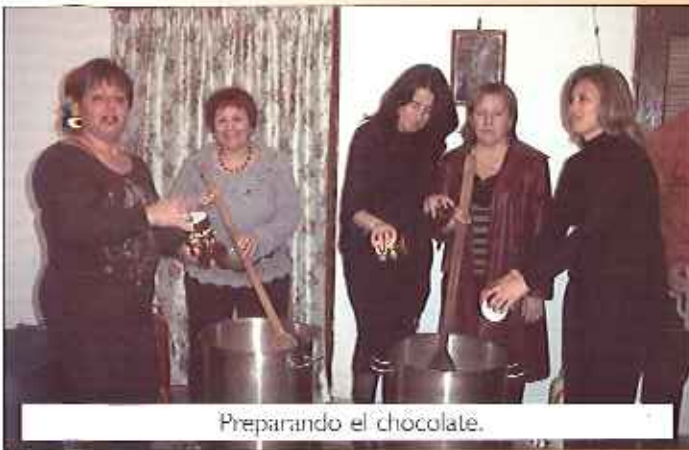
Preparando el chocolate.