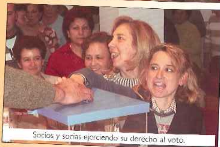
Socios y socias ejerciendo su derecho al voto.