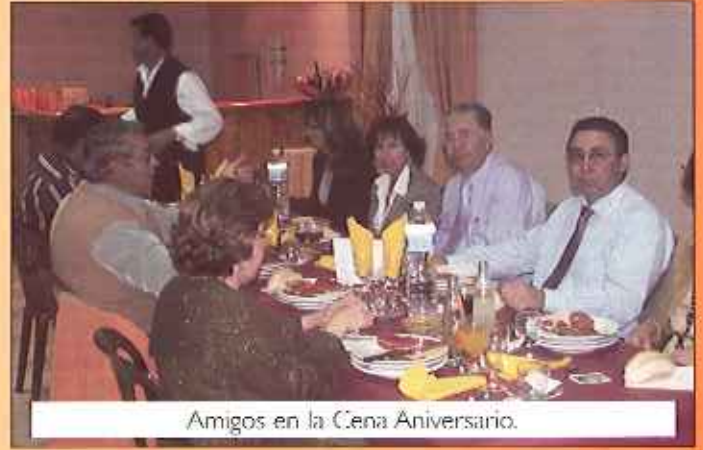
Amigos en la Cena Aniversario.