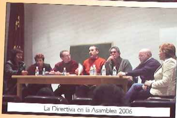
La Directiva en la Asamblea 2006