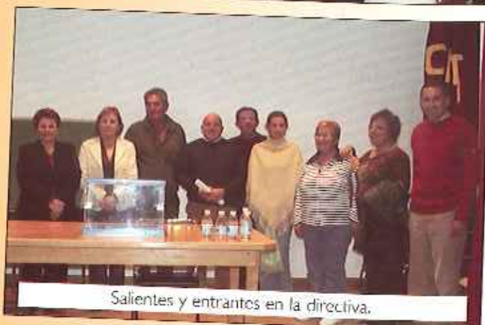
Salientes y entrantes en la directiva.