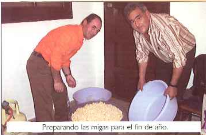
Preparando las migas para el fin de año.