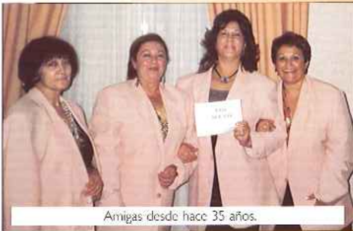
Amigas desde hace 35 años.