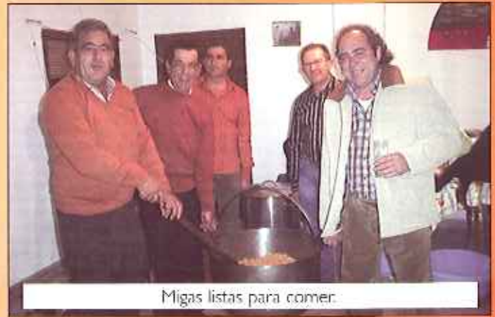
Migas listas para comer.