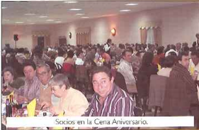
Socios en la Cena Aniversario.