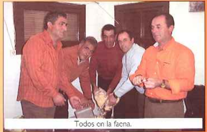
Todos en la faena.