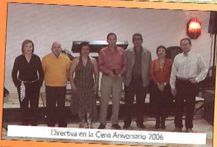
Directiva en la Cena Aniversario 2006