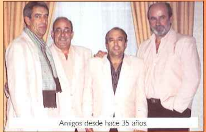
Amigos desde hace 35 años.