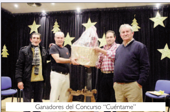
Ganadores del Concurso "Cuéntame"