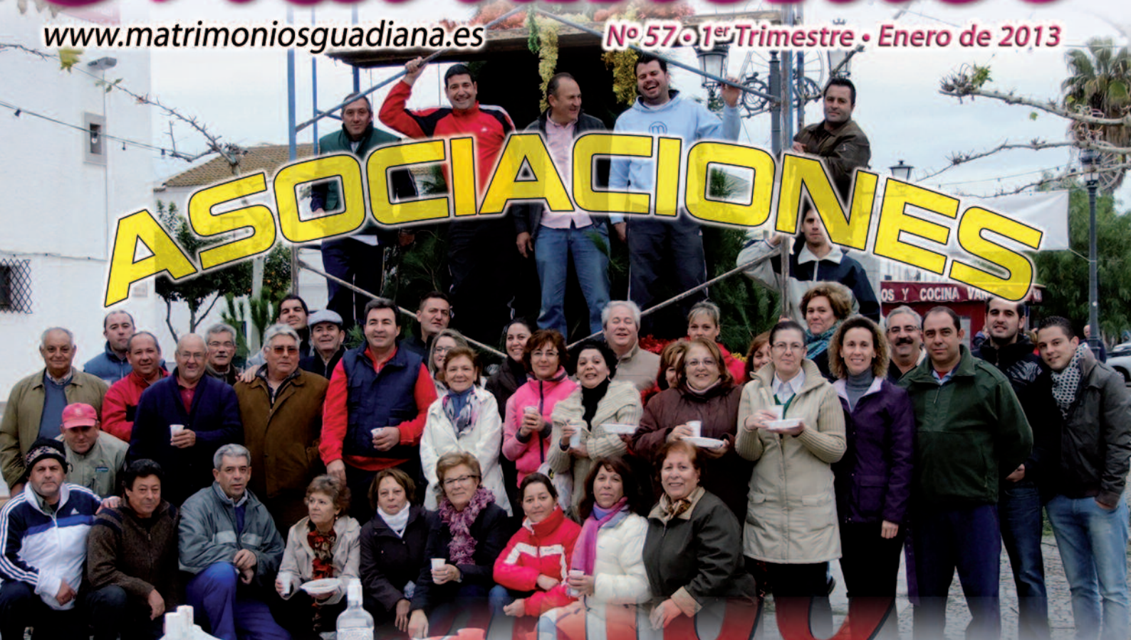
Directiva Cofradía de la Borriquita