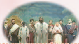
10º RESURRECCIÓN DE JESÚS DE NAZARET