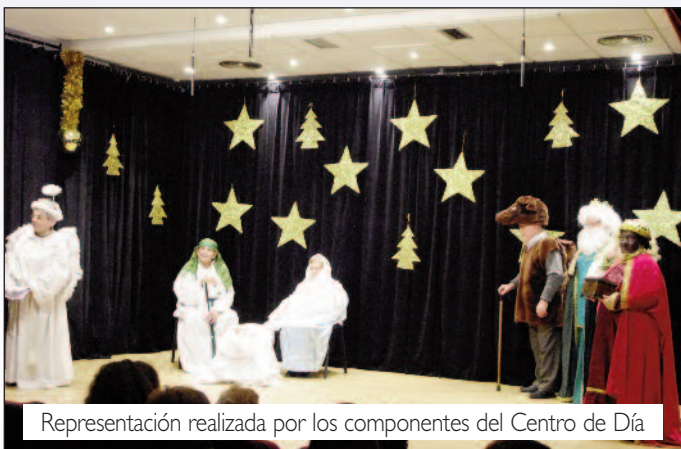
Representación realizada por los componentes del Centro de Día