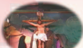
8º JESÚS EN LA CRUZ Y MUERTE