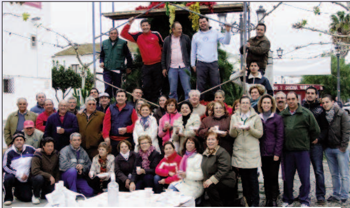
Convivencia de Asociaciones montando el árbol de Navidad