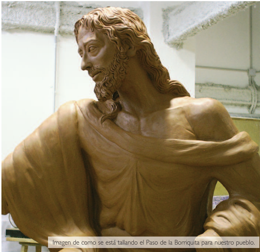
Imagen de como se está tallando el Paso de la Borriquita para nuestro pueblo.