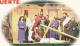
7º JESÚS CAMINO DEL CALVARIO