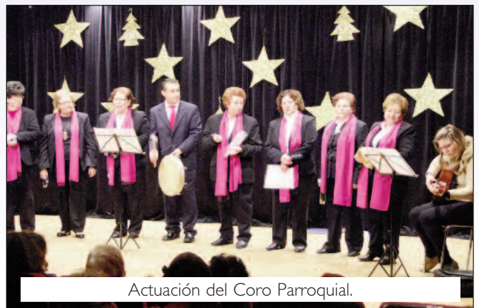
Actuación del Coro Parroquial.