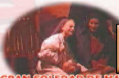
9º GRAN SOLEDAD DE MARÍA Y ENTIERRO