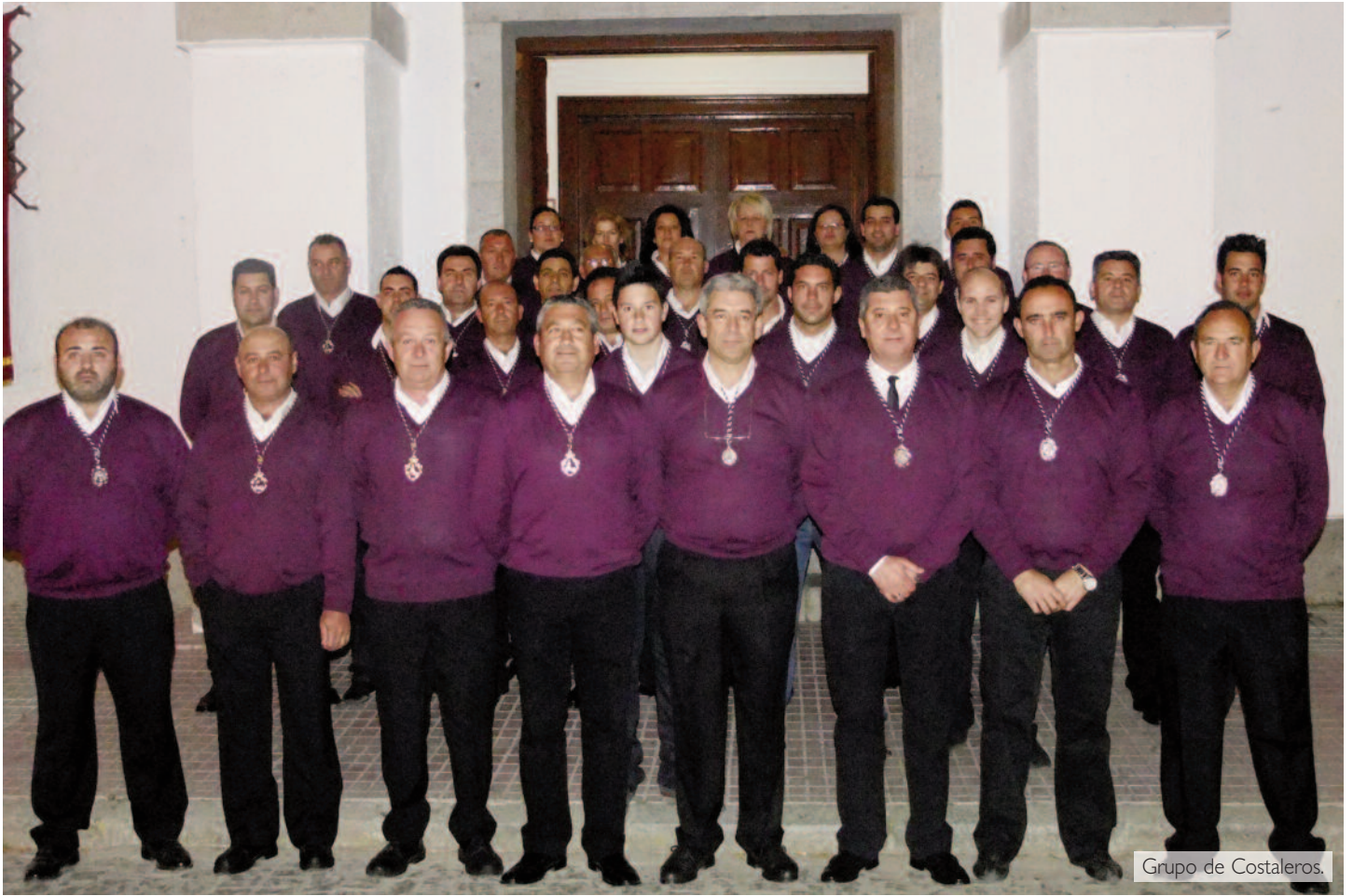
Grupo de Costaleros.

sobra nada en él. Me atrae su sencillez y como cala en nuestro sentir hacia la patrona. Prueba de ello es que ha tenido una aceptación y una participación excepcional por parte de todo el pueblo.