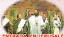
1º ENTRADA EN JERUSALÉN Y VENTA DE JUDAS