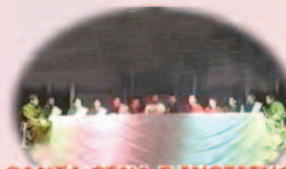
2º SANTA CENA E INSTITUCIÓN DE LA EUCARISTÍA