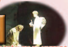
3º ORACIÓN EN EL MUERTO Y PRENDIMIENTO