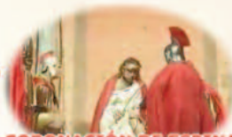
6º CORONACIÓN DE ESPINAS Y SENTENCIA A MUERTE