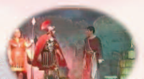
4º NEGACIONES DE PEDRO Y FINAL DE JUDAS