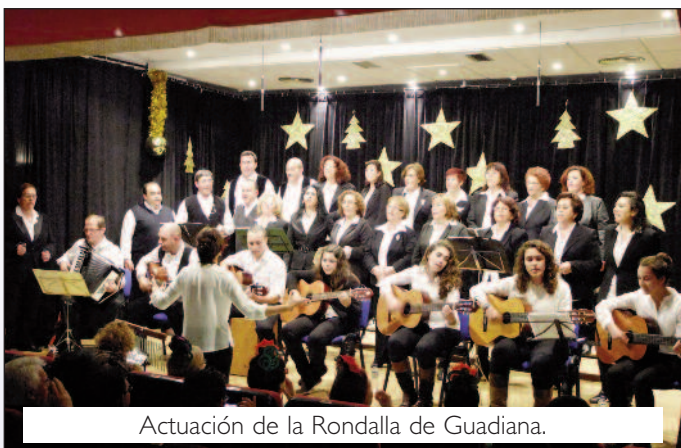
Actuación de la Rondalla de Guadiana.