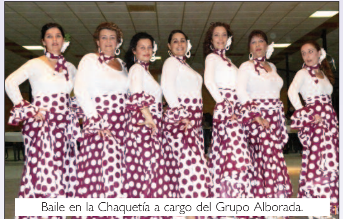
Baile en la Chaquetía a cargo del Grupo Alborada.