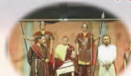
5º JESÚS ANTE PONCIO PILATO

Obra en tres actos, subdividida en diez cuadros