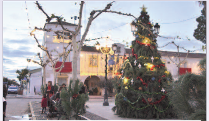
Navidad en Guadiana