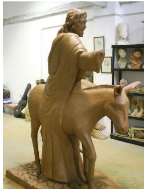
Talla del Paso de la Borriquita realizada por Daniel del Valle