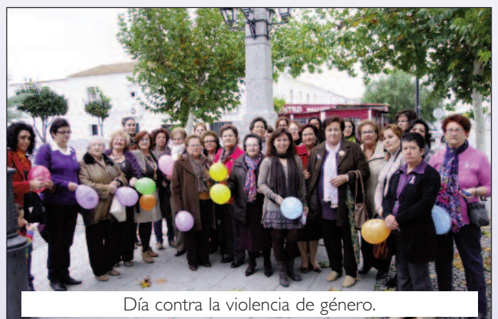
Día contra la violencia de género.