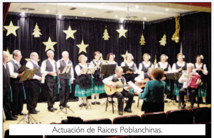
Actuación de Raíces Poblanchinas.