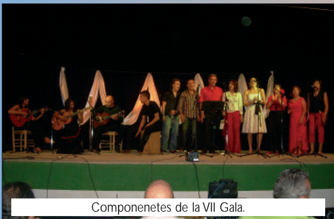
Componenetes de la VII Gala.