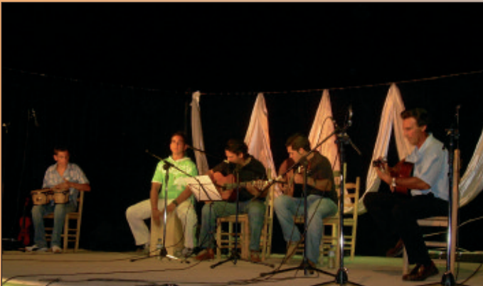
Homenaje a la guitarra.