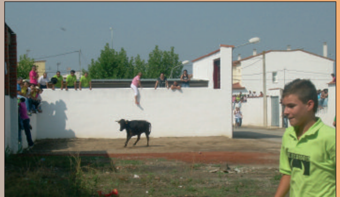
Arriba no llega la vaquilla.