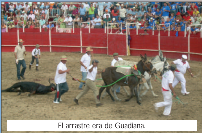
El arrastre era de Guadiana.