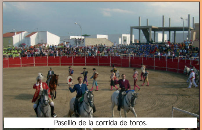
Paseillo de la corrida de toros.