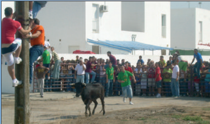
A los del poste no los coge.