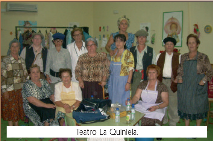
Teatro La Quiniela.