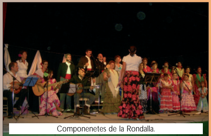
Componenetes de la Rondalla.