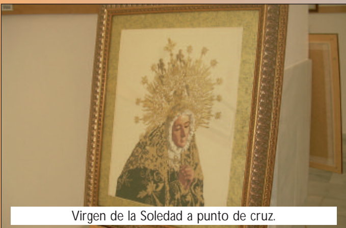
Virgen de la Soledad a punto de cruz.