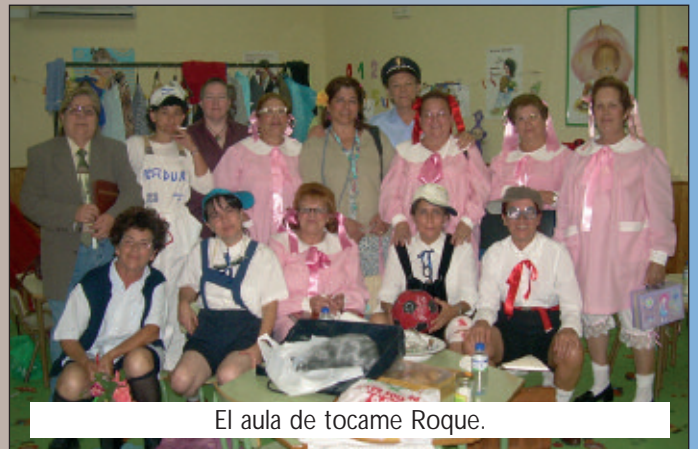
El aula de tocame Roque.