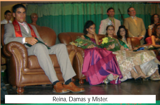
Reina, Damas y Mister.