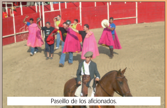
Paseillo de los aficionados.