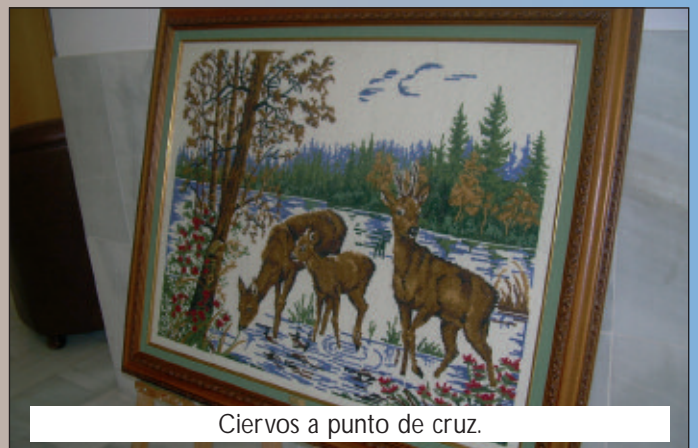
Ciervos a punto de cruz.