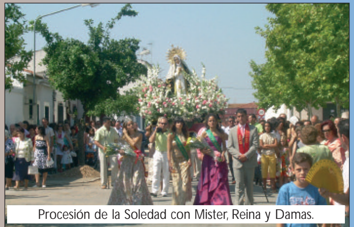
Procesión de la Soledad con Mister, Reina y Damas.