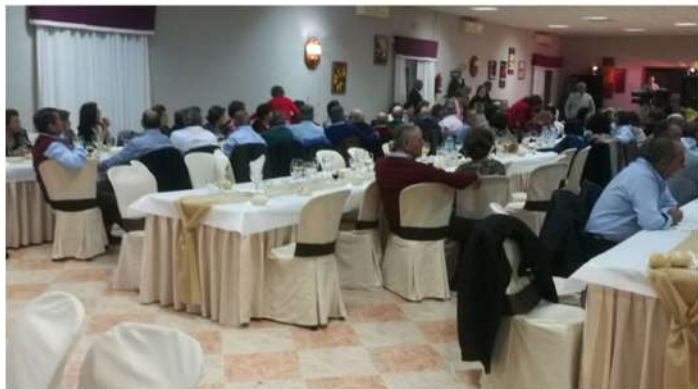
SORTEO DE REGALOS