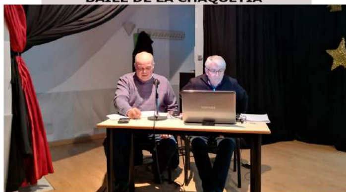
CHARLA COLOQUIO SOBRE GUADIANA