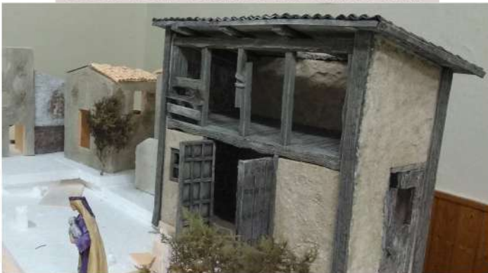
SEGUIMOS CON LA CONSTRUCCIÓN