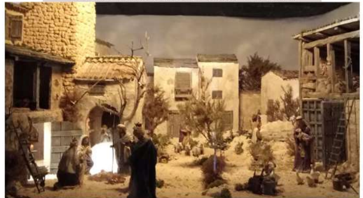
EL BELEN YA TERMINADO