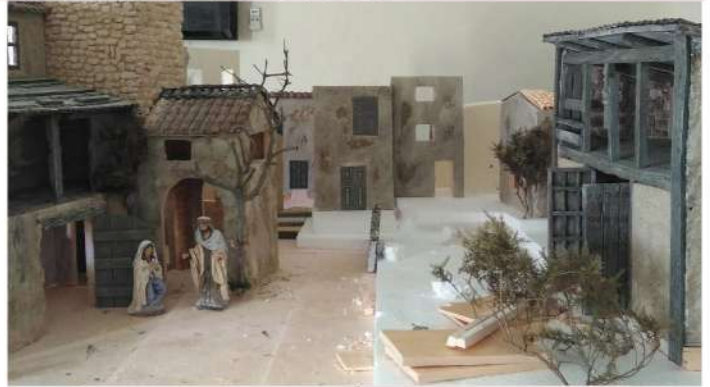
CONSTRUCCIÓN DEL BELEN