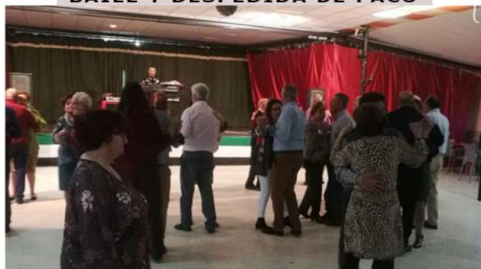
BAILE DE LA CHAQUETÍA