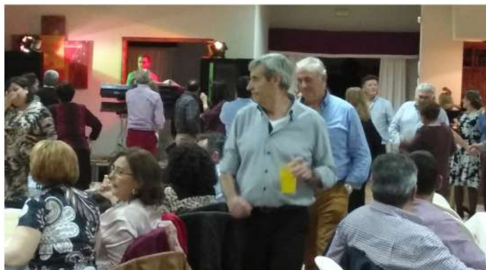
CENA DEL 20 ANIVERSARIO