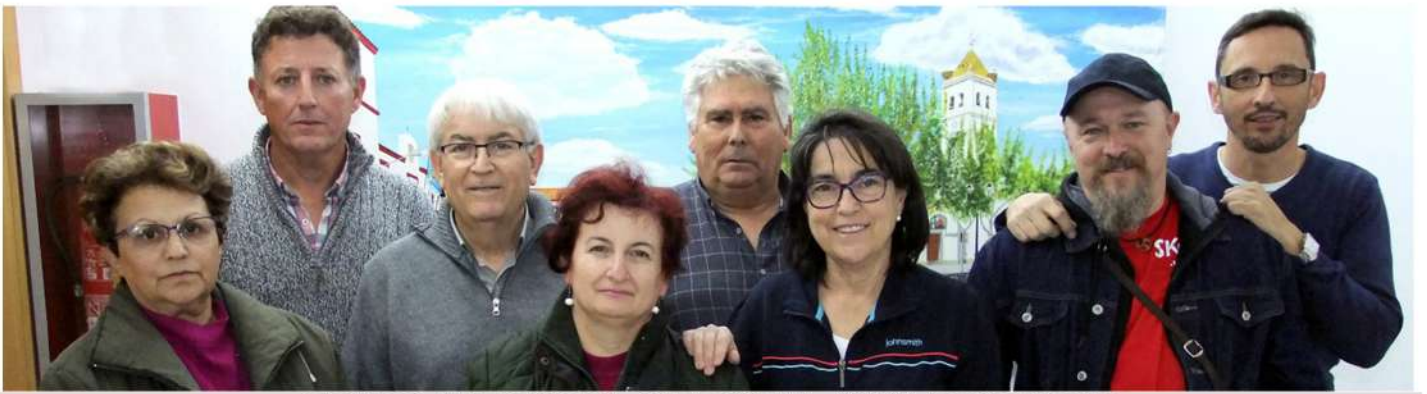
GRUPO BELENISTA GUADIANA VIVA 2018/2019