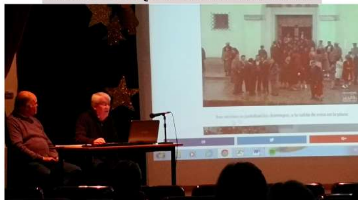
HISTORIA VISUAL DE NUESTRO PUEBLO