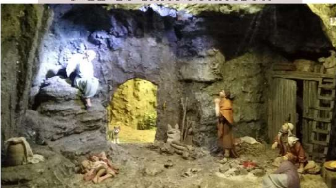
DIORAMA APARICIÓN PASTORES