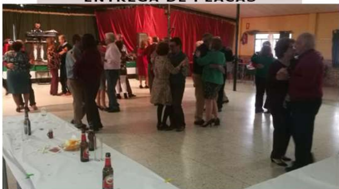
DÍA DE LA CHAQUETÍA