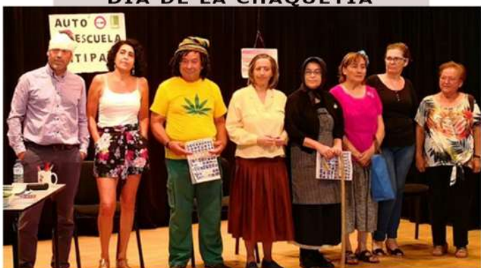
LOBON Y PUEBLONUEVO TEATRO POR UNA BUENA CAUSA