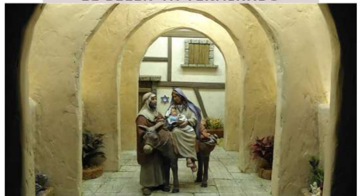
DIORAMA HUIDA A EGIPTO