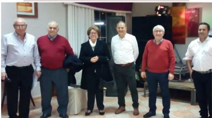
ENTREGA DE PLACAS