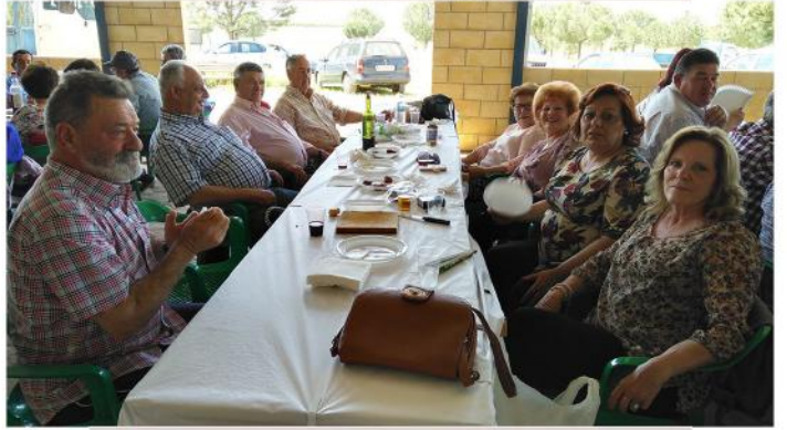
GRUPO DE FRASCORRO