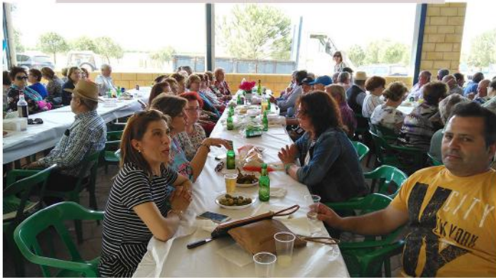
GRUPOS DEL CANO Y QUICO