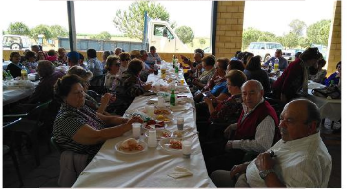
GRUPO LOS PRIMEROS