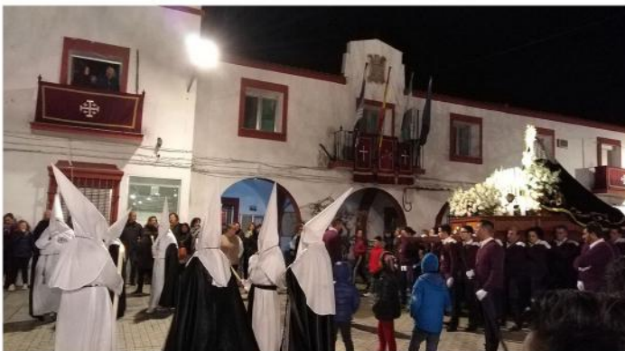
PROCESIÓN DEL SILENCIO