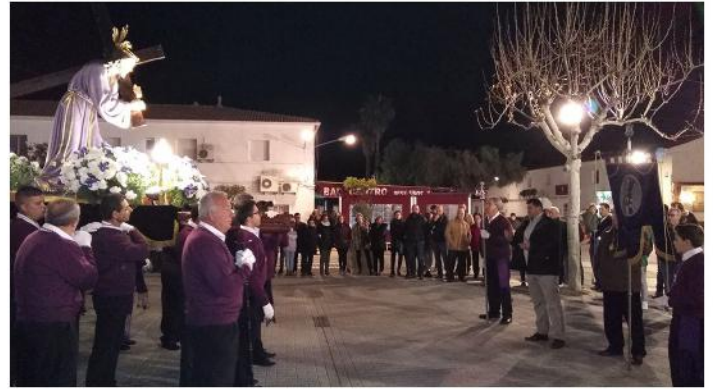
PROCESIÓN DEL NAZARENO