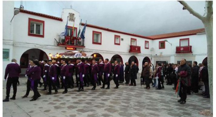
PROCESIÓN SANTO ENTIERRO