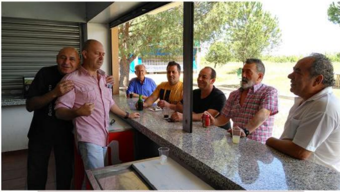
EN LA CANTINA