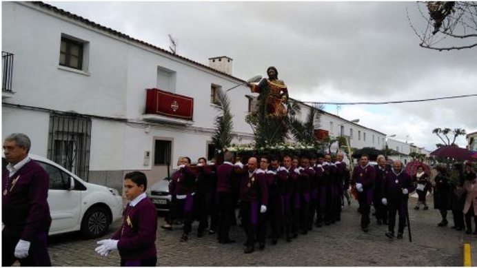
PROCESIÓN DE LA BORRIQUITA