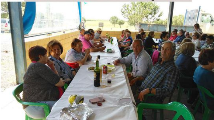
GRUPOS AURORA Y SATU