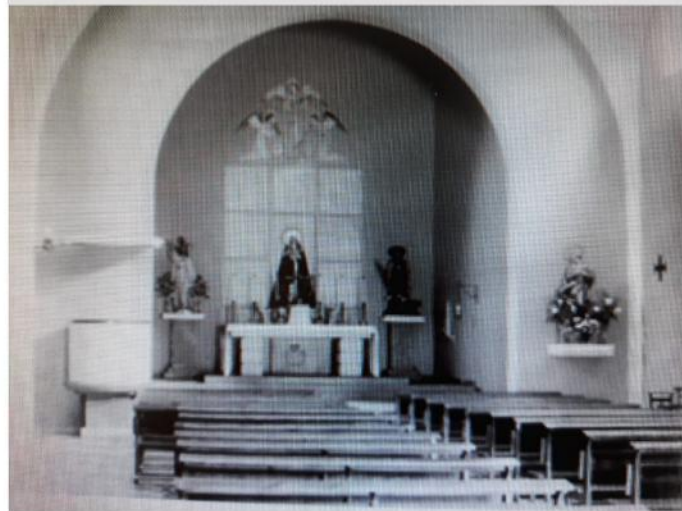
Parroquia Nuestra Señora de la Soledad antes de la reforma en 1972

En el altar de granito gris pálido de 3 x 1 metros tiene incorporado las reliquias de S. Gaudioso y S. Grato. La consagración de la Iglesia (Única en todos los pueblos) consta de una lápida que dice: "Para gloria