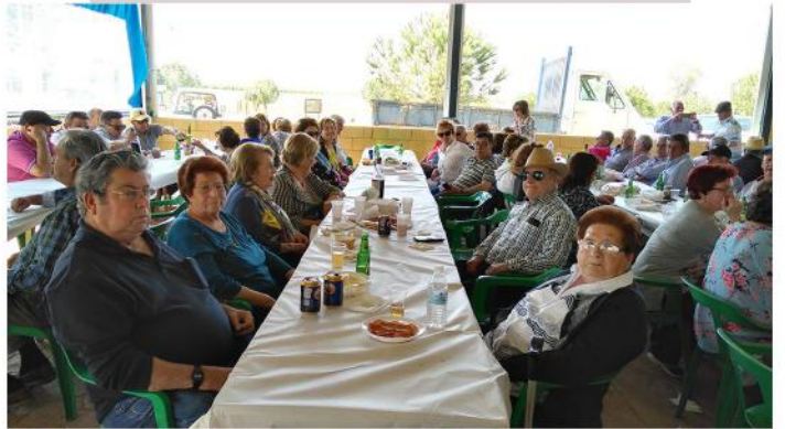
GRUPOS MARIANO Y CASTUOS