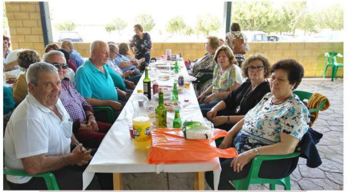
GRUPO DE CORRALES