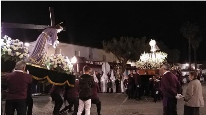
PROCESIÓN DEL ENCUENTRO