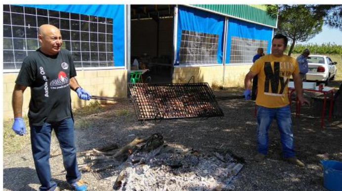
PREPARANDO LAS SARDINAS