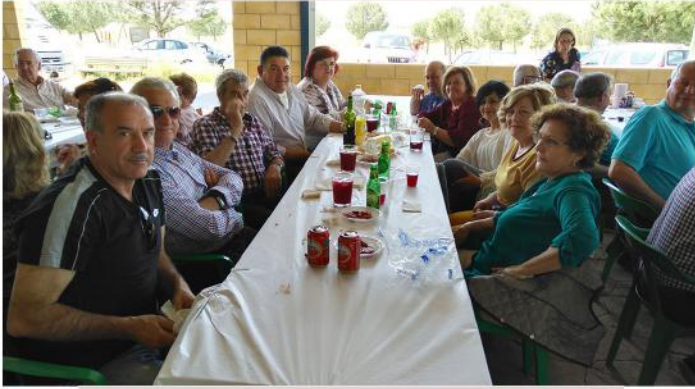
GRUPO DEL PICA