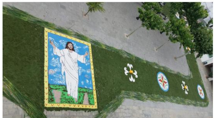
ALFOMBRA DEL CORPUS 2018